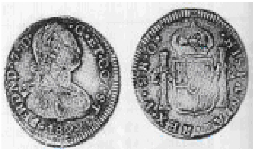
(2 reales 1822, Popayán. Fernando VII. Esfinge de Carlos IV)