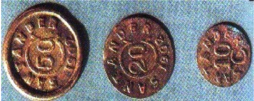
Departamento de Santander, 10, 20 y 50 centavos (“coscojas”)