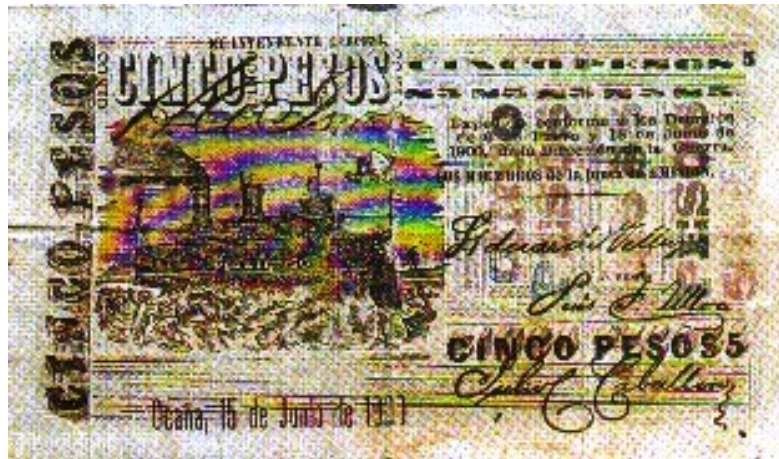
Cinco pesos (“peralonsos”), Ocaña, 1900 (anverso y reverso)