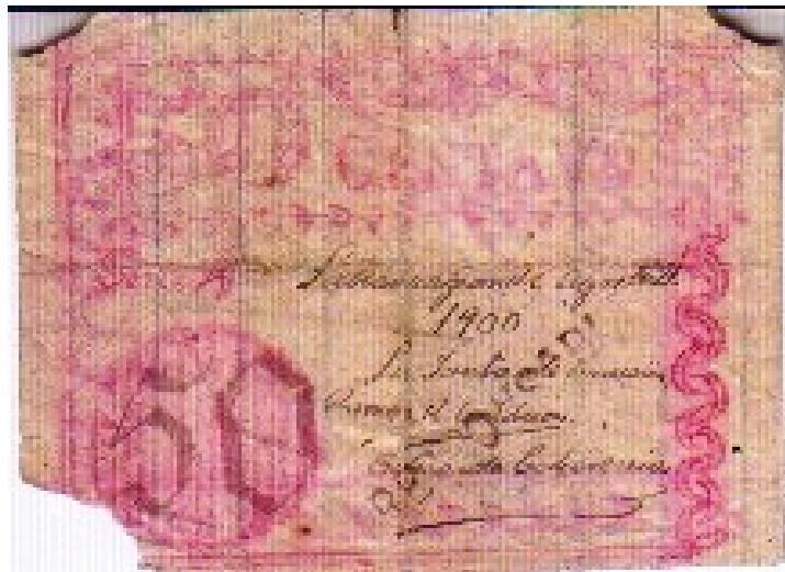
El Jefe Civil y Militar, cincuenta centavos, Labranzagrande, 1900