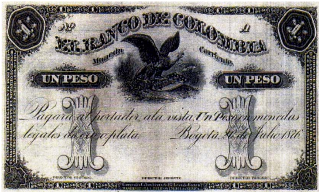
Banco de Colombia, un peso, 1876 (Anverso)

Los billetes del Banco de Colombia son muy raros, a excepción de las cédulas hipotecarias del siglo XX. En la pasada subasta de Numismáticos Colombianos, se subastó una pieza de un peso del Banco de Colombia de 1876, en estado 8 y a un notable precio. Este billete está sin circular.