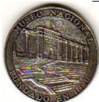
Medalla conmemorativa Museo Nacional, 1960

En el año de 1960, para conmemorar los 150 años de Independencia, se acuñó una medalla por la Casa de Moneda de Bogotá, en plata de Ley, que muestra, en el anverso, la fachada del edificio donde hoy se encuentra el Museo Nacional, con sus escalinatas que dan a la carrera séptima. En contorno dice: Museo Nacional Fundado en 1823. Por el reverso trae, las figuras de Bolívar y Santander, en contorno: 1810-1960 Bogotá Colombia. Se la mostramos enseguida.