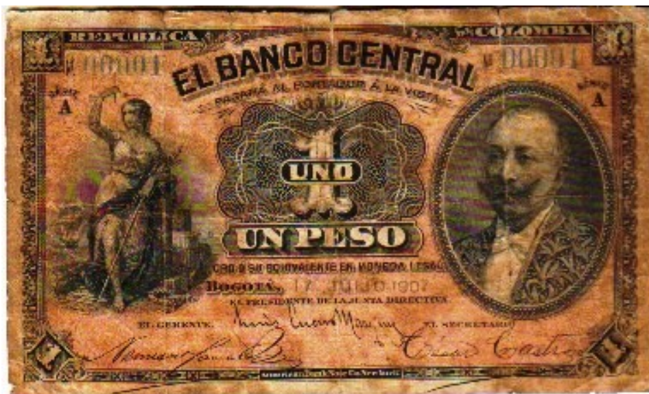
Banco Central, un peso, 1907. Serie A, No. 00001