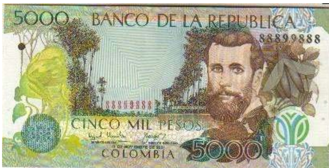
Banco de la República, 5000 pesos, 2001. (Radar)

Hoy les mostramos un billete radar de cinco mil pesos del Banco de la República, con fecha 11 de noviembre de 2001. Su número es: 88899888 . Lo pueden visualizar enseguida.