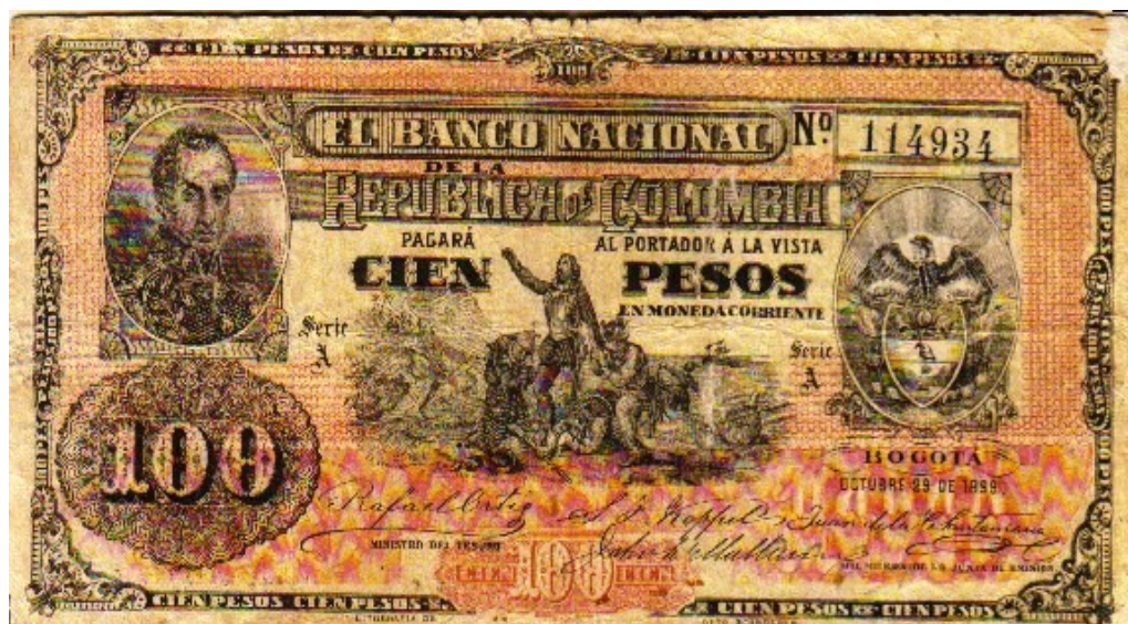
Banco Nacional, 100 pesos, 1899. Serie A. (Cristóbal Colón)