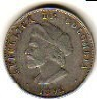
Cincuenta centavos, 1892. (Cristóbal Colón)