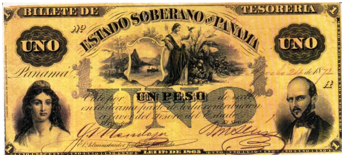
Estado Soberano de Panamá, 1 peso, 1871