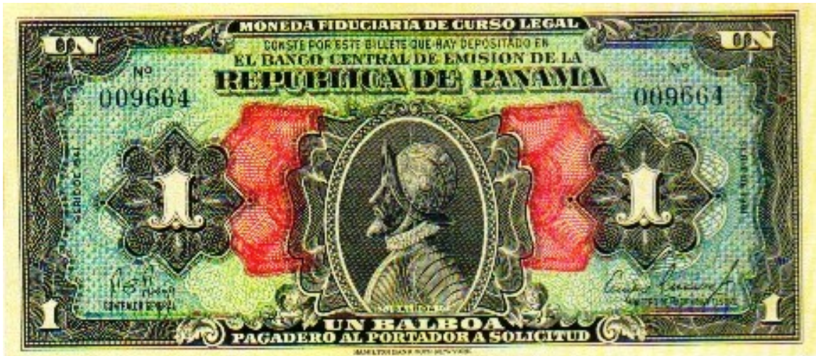
Banco Central de Emisión de la República de Panamá, 1 balboa

Desde la creación de la República de Panamá siempre han existido dos patrones monetarios, uno en metálico, el balboa y el otro en papel, el dólar de los Estados Unidos de América. En moneda metálica, circula el balboa en valores de 1, 5, 10, 25 y 50 centésimos.