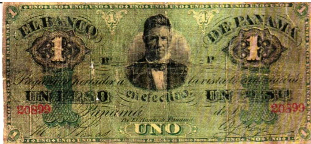
Banco de Panamá, 1 peso