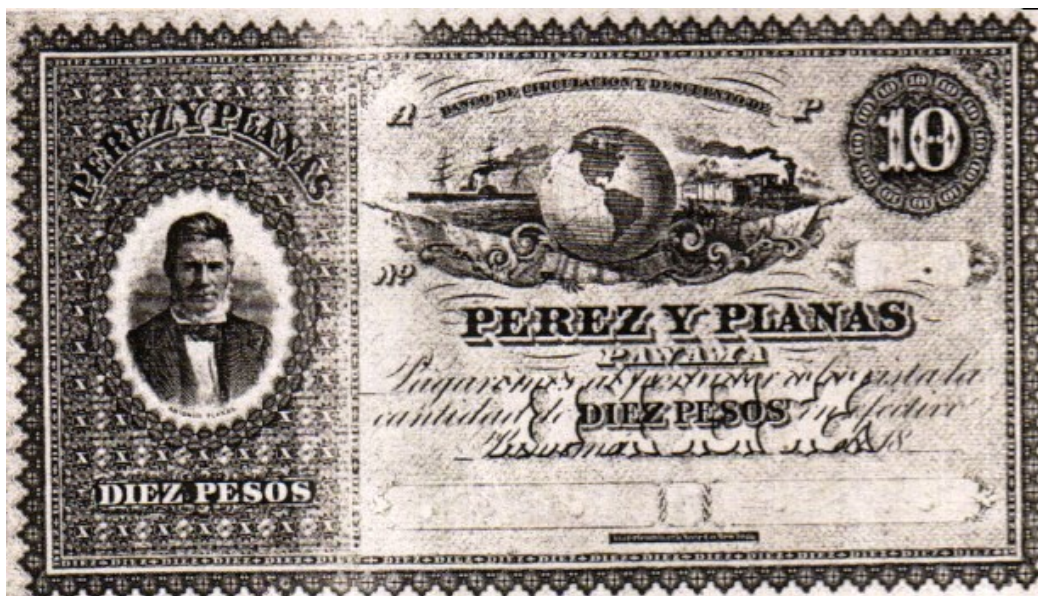
Banco de Pérez y Planas, 10 pesos

En el año de 1861 se estableció el Banco de Circulación y Descuento de Pérez y Planas, fundado por los señores Tadeo Pérez Arosemena y Ricardo Planas. Estaba autorizado por el Gobierno Central para emitir billetes y realizar todas las operaciones correspondientes a bancos según la legislación vigente. La primera emisión de billetes fue en valores de 1 peso Pick. S726, 2 pesos Pick. S727, 3 pesos Pick. S728, 5 pesos Pick. S729 y 10 pesos Pick. S730. Todos ilustrados con el retrato del Señor Planas. El establecimiento de este banco fue antes del banco de Londres, México y Sud América que inició operaciones en la ciudad de Bogotá en 1865, cuatro años después del de los señores Pérez y Planas.