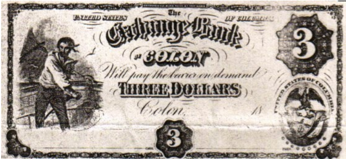
Exchange Bank Of Colon, 3 dólares