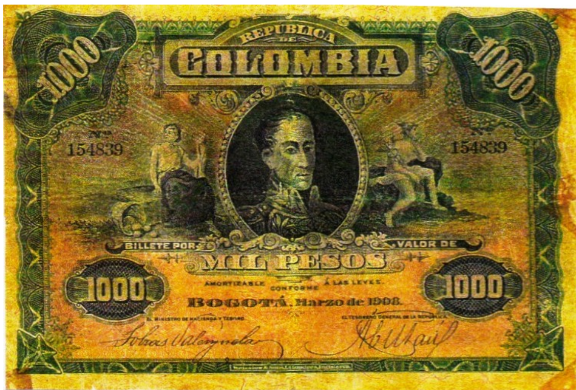
República de Colombia, 1000 pesos, 1908

En 1908, cuando en Colombia no existía Banco Emisor Oficial, pues el último (Banco Central) ya había cerrado sus puertas, la República de Colombia emitió este valor, muy alto para la época, en un tamaño poco usual, pues mide 11 por 17 cm. Con un bello diseño. La impresión la realizó Waterlow & Sons. Londres. Inglaterra. Por el anverso, a dos líneas, dice: República de Colombia, trae la esfinge de Simón Bolívar dentro de un óvalo con figuras a ambos lados, alegóricas a la libertad y el dios Mercurio. Por el reverso: el escudo de Colombia sostenido por dos ángeles en color rojo. El color del anverso es verde oliva y el del reverso rojo.