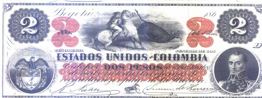
Dos pesos. Tesorería Jeneral de los Estados Unidos de Colombia. 186.

La imagen de Bolívar apareció por primera vez en un billete de la Tesorería Jeneral de los Estados Unidos de Colombia, por valor de dos pesos. Bogotá 186., dado a la circulación en la ciudad de Pasto el 18 de noviembre de 1863. Anverso: a la derecha, retrato de Bolívar; a la izquierda, escudo nacional; en el centro, una escena de vaquería. Serie D. Fondo blanco, letras negras, número y dibujos en rojo. Impreso por American Bank Note Co. de New York. Pick 75.