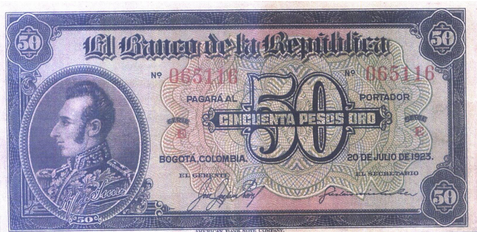
Cincuenta pesos. Banco de la República. Bogotá 1923

El General Sucre, aparece en billetes de bancos privados y en los del Banco de la República de 1923 a 1967. Anverso: Banco de la República. Bogotá Julio 20 de 1923.