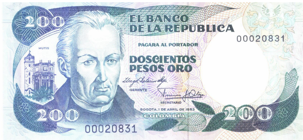
Doscientos pesos. Banco de la República. Bogotá 1983

Aparece en los billetes de doscientos pesos del Banco de la República de 1983 a 1992. Anverso: retrato de José Celestino Mutis e imagen del Observatorio Astronómico Nacional, ubicado hoy día, a un costado de los jardines del Palacio de Nariño.