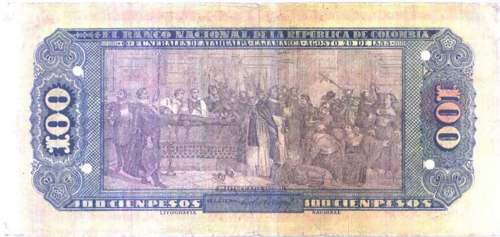
Cien pesos. Banco de la República de Colombia. 1900