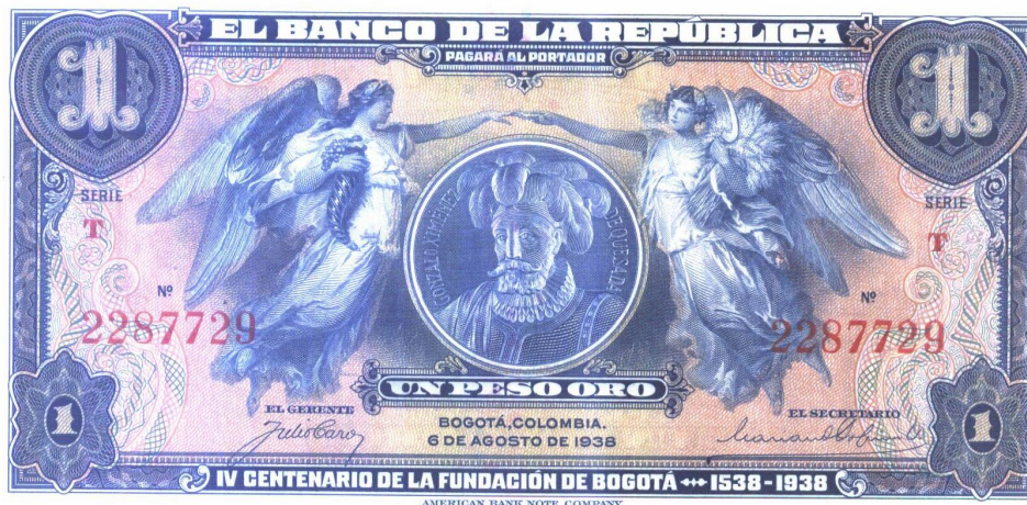
Un peso. Banco de la República. Bogotá 1938

En el año de 1938, para conmemorar los cuatrocientos años de la fundación de Bogotá, el Banco de la República sacó a la circulación un hermoso billete por valor de un peso, en donde por el anverso y sobre un óvalo sostenido por dos ángeles (alegorías de la abundancia y de la agricultura) aparece la imagen del conquistador Jiménez de Quesada. Bogotá 1538-1938. Color predominante, el azul; números de serie, en rojo. Se encuentran de seis y siete dígitos.