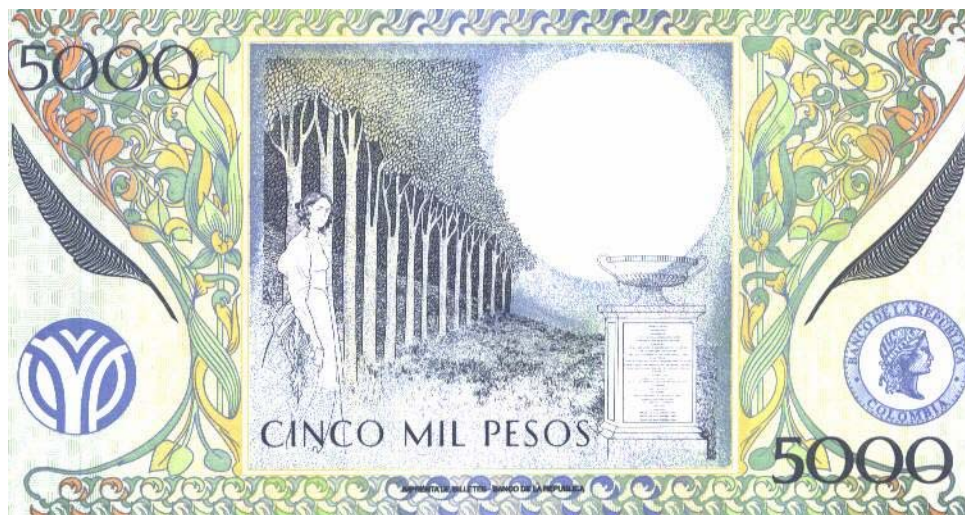
Banco de la República, cinco mil pesos