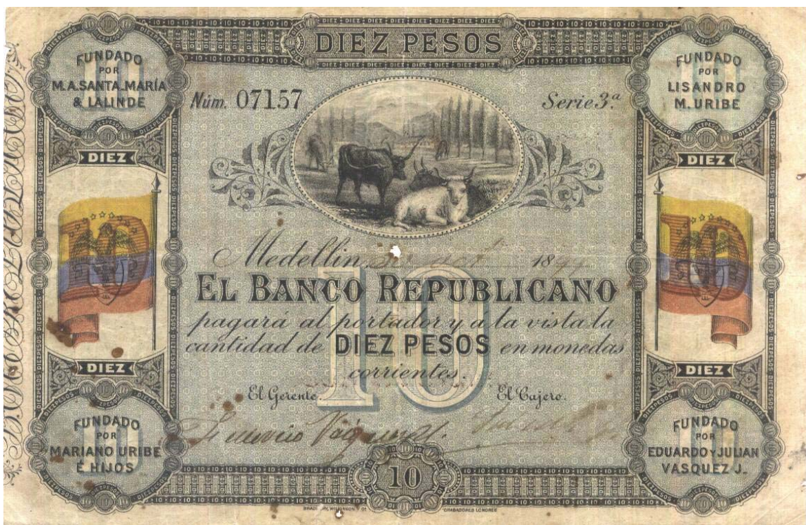
10 pesos Banco Republicano de Medellín

Aquí les mostramos el valor de diez pesos, el cual se encuentra resellado por el reverso para el Banco de Medellín. Anverso: Banco Republicano pagará al portador y a la vista la cantidad de diez pesos en monedas corrientes. El Gerente – el Cajero. Serie 3 a . Nombre de los fundadores en las cuatro esquinas. Bandera colombiana a lado y lado. Viñeta central: una escena de vaquería. Cinco dígitos. Colores muy vistosos. ¡Un raro ejemplar!