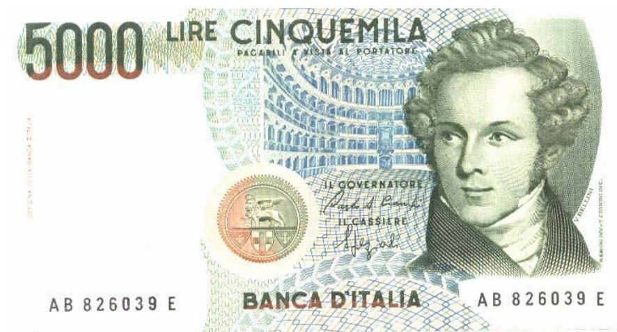
Banco de Italia cinco mil liras 1985

Compositor italiano. Nació en Catania, Sicilia, y se educó en el conservatorio de música de Nápoles. El estreno de su primera ópera, Adelson e Salvini en 1825, atrajo la atención de Domenico Barbaja, director del teatro de ópera San Carlo de Nápoles y de La Scala de Milán. Barbaja le encargó componer Bianca e Gerardo para el teatro San Carlo en 1826 e Il Pirata para La Scala en 1827. Ambas tuvieron gran éxito, así como La Straniera (1829) e I Capuletti e Montecchi (1830). En 1831, el estreno de sus dos óperas más populares, La Sonnambula y su obra maestra Norma , le dieron la fama internacional. En 1833 estrenó Beatrice di Tenda , con la que no tuvo el éxito esperado, y en 1835 I Puritani , su última obra. Bellini fue un artista meticuloso. Compuso para virtuosos del bel canto, forma de expresión lírica que exige gran precisión y agilidad vocal. Daba mucha importancia a la relación entre la música y el texto y sus óperas consiguen gran efecto dramático a través de sus melodías, admiradas por su peculiar belleza. (Tomado de www.epdlp.com ). El Banco de Italia le ha rendido un homenaje a este compositor, con la presencia de su imagen por el anverso de un billete de cinco mil liras, del 4 de enero de 1985.