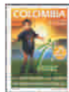
Circé 25 años