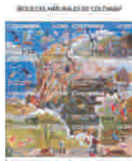
Riquezas naturales de Colombia