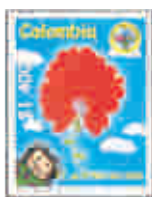
Día del niño