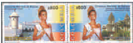
Concurso Nacional de Belleza