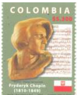
Federico Chopin. Mayo 25 de 2006. 12.500 hojas bloque. 50.000 estampillas.