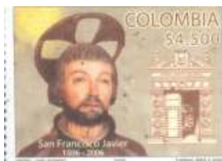
San Francisco Javier. Abril 7 de 2006. 33.333 hojas bloque. 200.000 estampillas.