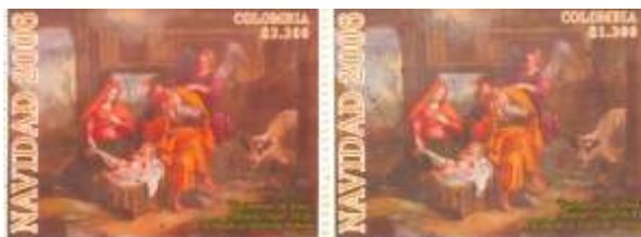
Navidad 2006. Diciembre 13 de 2006. 8.333 hojas bloque. 50.000 estampillas.