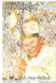
S.S. Juan Pablo II. 20 años de la Visita. Abril 4 de 2006. 33.333 hojas bloque. 200.000 estampillas.