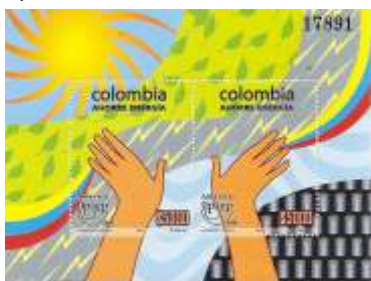
América UPAEP: Ahorro de Energía. Diciembre 28 de 2006. 12 hojas filatélicas. 24.000 estampillas.