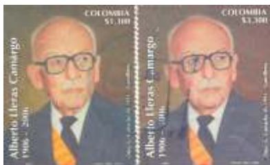
Alberto Lleras Camargo 100 años. 6 de diciembre de 2006. 11.110 hojas bloque. 100.000 estampillas.