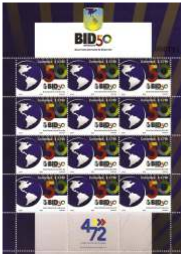
50 Aniversario del Interamericano de Desarrollo BID. Marzo 31 de 2009. 120.000 estampillas.