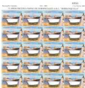
75 años Escuela Naval de Suboficiales A. R. C. " Barranquilla" Abril 17 de 2009. 120.000 estampillas.