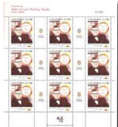
Presidente Julio César Turbay Ayala 1916 - 2005. Abril 1 de 2009. 90.000 estampillas.