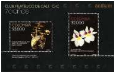
Club Filatélico de Cali (CFC) 70 años. Marzo 12 de 2009. 60.000 hojas filat é licas.