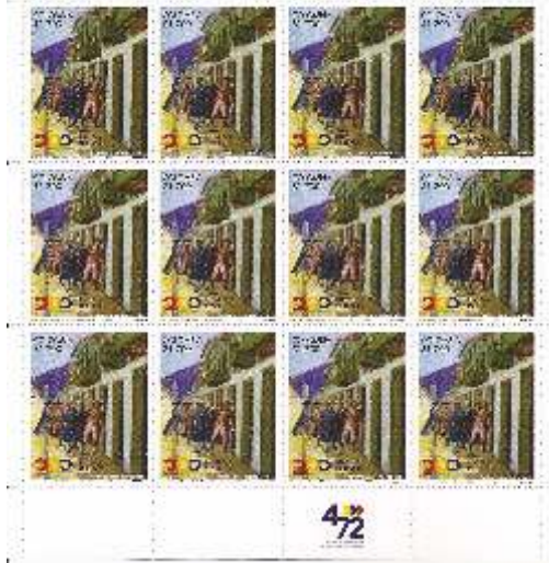
Grupo Bicentenario: Libres y Unidos. Junio 25 de 2009. 600.000 estampillas