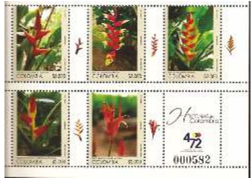
Heliconias de Colombia. Agosto 14 de 2009. 250.000 estampillas.