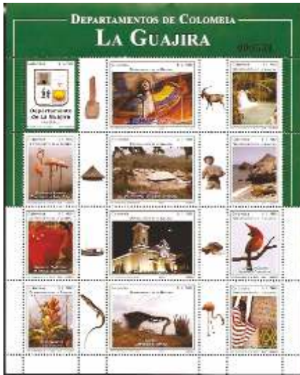
Departamentos de Colombia: Guajira. Julio 24 de 2009. 240.000 estampillas.