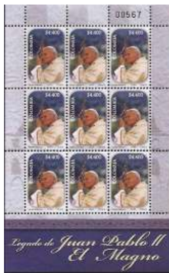
Legado de Juan Pablo II El Magno. Febrero 19 de 2010. 126.000 estampillas.