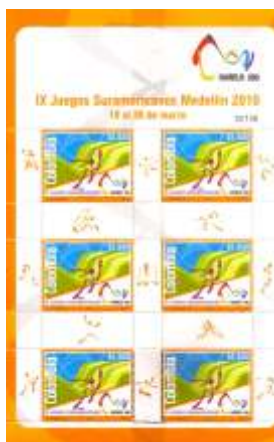
IX Juegos Suramericanos Medellín 2010. Febrero 18 de 2010. 30.000 estampillas.