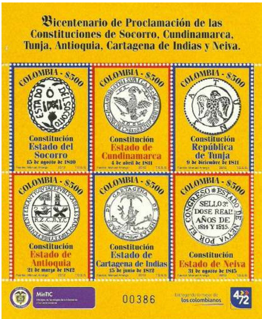
Emisión "Bicentenario de la Proclamación de las Constituciones del Socorro, Cundinamarca, Tunja, Antioquia, Cartagena de Indias y Neiva". Diciembre 19 de 2012. Bogotá, D.C., Colombia