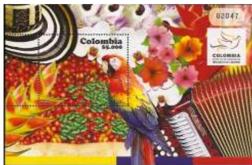
Expo Shanghai 2010. Mayo 1 de 2010. 60.000 hojas filatélicas.