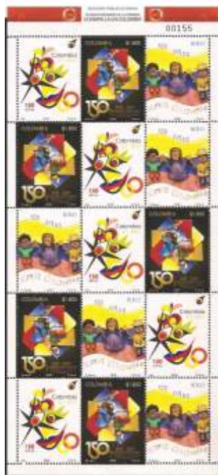
Concurso público de sesquicentenario de la primera estampilla en Colombia. Enero 28 de 2010. 45.000 estampillas.