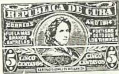
Gertrudis Gómez de Avellaneda

La emisión se realizó el 24 de febrero de 1914 con el fin de recordar el centenario del nacimiento de la escritora camagüeyana Gertrudis Gómez de Avellaneda.