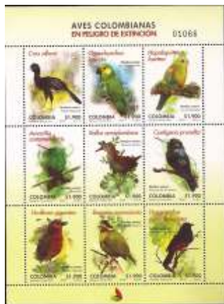
Aves colombianas en peligro de extinción. Abril 6 de 2010. 288.000 estampillas.