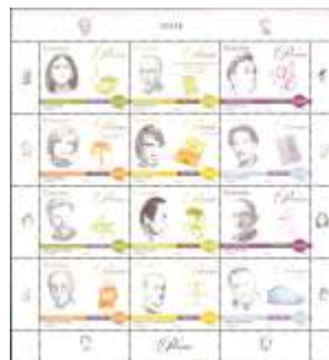
Personajes colombianos de todas las épocas (I). Enero 28 de 2010. 60.000 estampillas.