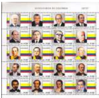
Presidentes de Colombia. Octava edición. Enero 28 de 2010. 100.000 estampillas.