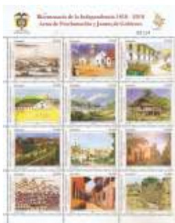
Bicentenario de la Independencia 1810 - 2010: Actas de Proclamación y Juntas de Gobierno. Octubre 22 de 2010. 90.000 estampillas.