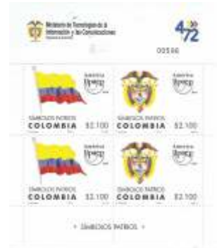
América UPAEP 2010: Símbolos patrios. Octubre 12 de 2010. 56.000 estampillas.