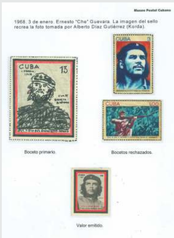
Diseños para la emisión de la estampilla con la foto de Korda

En la Sala Transitoria del Museo se exhibió una Muestra Filatélica relacionada con el Che Guevara, que incluyó ensayos, bocetos aprobados y rechazados, pruebas y diseños de las estampillas y los cachet de los sobres de primer día, entre otros aspectos temáticos.