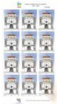
Instituto de Bellas Artes 1910 - 2010. Octubre 20 de 2010. 42.000 estampillas.