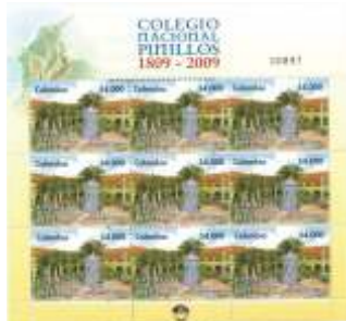
Colegio Nacional Pinillos. Agosto 27 de 2010. 68.400 estampillas.