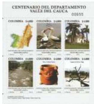
Centenario del Departamento Valle del Cauca (1910 - 2010). 72.000 estampillas.