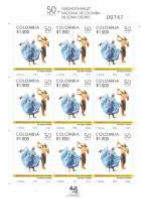
Fundación Ballet Nacional de Colombia de Sonia Osorio 50 años. Noviembre 23 de 2010. 90.000 estampillas.