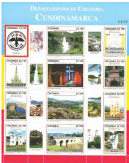
Emisión: “Departamentos de Colombia: Cundinamarca”. Julio 16 de 2013. Bogotá, D. C., Colombia. 42.000 estampillas.