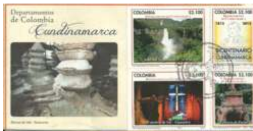
Sobres de primer día de la emisión: “Departamentos de Colombia”. Julio 16 de 2013. Bogotá, D. C., Colombia. 2.250 sobres numerados.