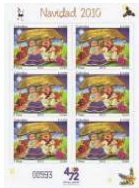
Navidad 2010. Noviembre 30 de 2010. 64.002 estampillas.