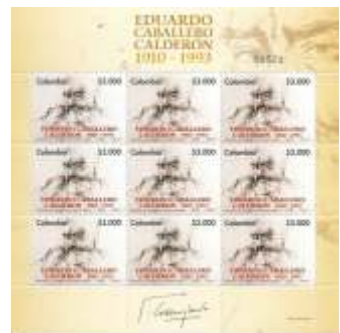
Eduardo Caballero Calderón 1910 - 1993. Diciembre 12 de 2010. 108.000 estampillas.