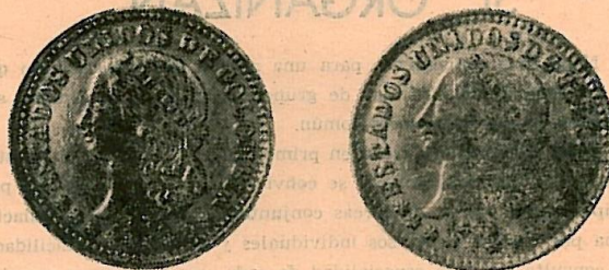
1871 DOS PESOS, MEDELLIN

fecha y resulta que la sobrefecha mencionada aparece con frecuencia. Invito a los lectores para que examinen sus monedas y estoy seguro de que varios de ustedes descubrirán la sobrefecha citada.