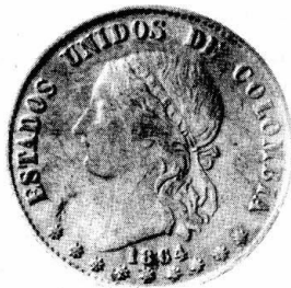
1863 DIEZ PESOS ,BOGOTÁ CON EFIGIE DIFERENTE Y 1864 DIEZ PESOS , BOGOTÁ

Lo que todos nos preguntamos en este momento es de dónde pudieron haber salido tantas monedas colombianas que antes eran consideradas verdaderas rarezas o que no se conocían ? Parece que un banco europeo resolvió poner en subasta pública una enorme cantidad de piezas que tenía acumuladas como oro físico. Esta parece ser la única explicación aceptable. El aspecto mismo de las monedas, que indica que han sido mal tratadas, pues tienen múltiples pequeños rayones y lucen sucias y manchadas, tiende a confirmar esa teoría. Este acontecimiento ha sido un valioso aporte a la numismática colombiana. Los catalogadores tenemos la sensación de que ahora si se sabe que es lo que existe.