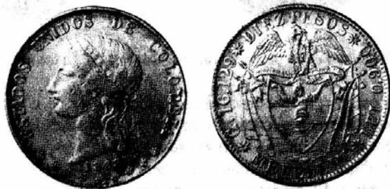
1868 DIEZ PESOS MEDELLIN CON EFIGIE DE BOGOTÁ

Se pensaría que se trata de una mula o moneda híbrida. Podría clasificarse como tal si no fuera porque ni Bogotá ni Popayán emitieron piezas de diez pesos fechadas 1868. Personalmente desconocía la existencia de esta pieza hasta cuando vi un fotografía en Bogotá. Pensé que debía tratarse de una pieza única pero no mucho tiempo después Ponterio, comerciante de San Diego, California, ofreció en subasta otro ejemplar en su catálogo N. 60 lote 216. Esta oferta dejaba bien establecida su existencia.