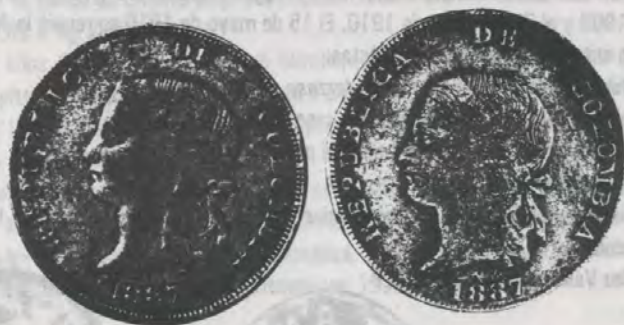
CABEZA EN POSICIÓN NORMAL Y BAJA (ATENCIÓN DE JORGE BECERRA)

Hacemos un llamado muy vehemente a los que tienen en sus colecciones alguna o algunas de las piezas relacionadas con esta acuñación de 1887 para que nos hagan sus comentarios y en lo posible nos faciliten conocer sus ejemplares o al menos las fotos respectivas. Ojalá que nos toque ver la integración de estos cuadros con la aparición de sendos ejemplares de la D al revés y del 2 al revés sin corregir.