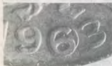
5 CENTAVOS 1963