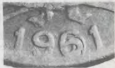
5 CENTAVOS 1961