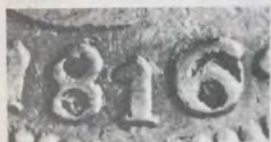
2 REALES 1816

Dada la similitud del 6 con el 9 incluyo también un 9 sobre 9 acostado en una pieza de 10 centavos aportada por Antonio Pedraza.