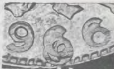
1 CENTAVO 1966