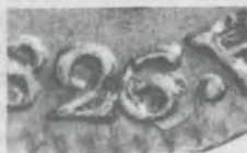
1 PESO 1826