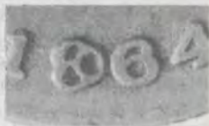
10 CENTAVOS 1964