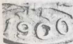
5 CENTAVOS DE 1960. NÓTESE EL EJEMPLAR QUE PARECE CORRESPONDER A 1900