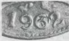
1 CENTAVO 1962