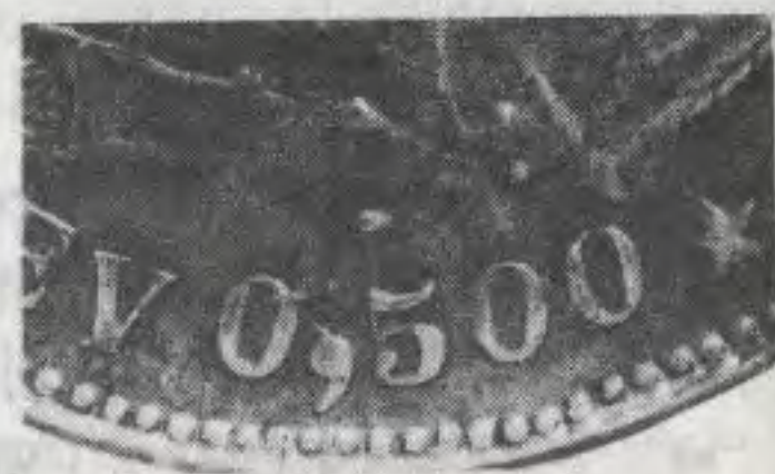
0/5 Y ,500 LIMPIO

Sobra decir que esta pieza no estaba catalogada. El 13 de Octubre apareció el afortunado descubridor, visiblemente emocionado, con la moneda en la mano y pidió que se la ayudáramos a clasificar, pues no coincidía con la muy conocida de cuatro estrellas. Apenas la examinamos estuvimos todos de acuerdo en que se trataba de un hallazgo importante. La reunión se convirtió en fiesta.