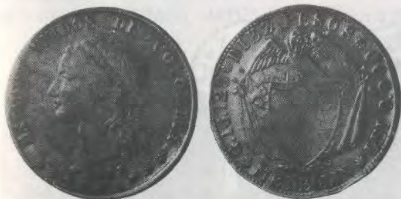
DIEZ PESOS 1868 MEDELLÍN, CON ANVERSO DE BOGOTÁ Y EL REVERSO DE LA DE 1867

En el número 71 de Numis-notas, anunciábamos la aparición de esta pieza que no figura en el catálogo y agregábamos que se conocían sólo dos piezas. Lo extraordinario, como lo hizo notar Antonio Pedraza, es que las dos piezas tenían reversos diferentes: El reverso de la del coleccionista de Bogotá era idéntico al reverso de la de 1867 de Medellín, mientras el de la publicada en Numis-notas tiene un reverso que no he podido aún identificar con el de otra pieza de la misma ceca.