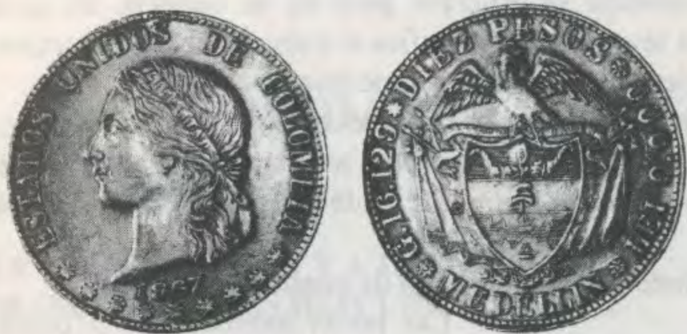
DIEZ PESOS 1867 MEDELLÍN