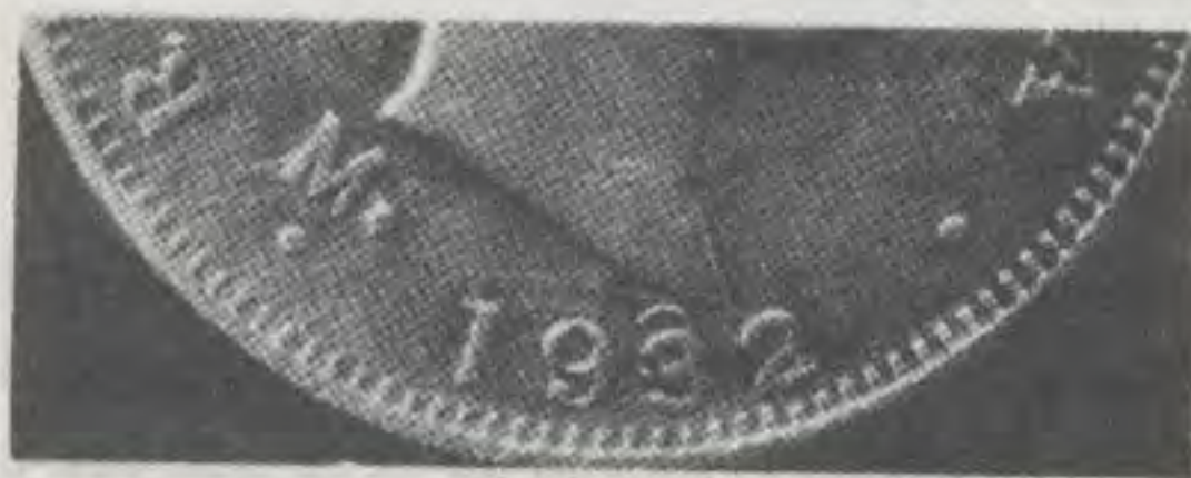
50c. 1932 M. 3 duplicado hacia arriba

A pesar de que las variedades de 1932 están muy bien explicadas e ilustradas en el volumen azul de Restrepo, sobre 50 centavos del siglo XX, no se deben omitir en este artículo dos piezas de revés duplicado, una de ellas 1932 sin marca de ceca, y la otra, 1932 M, ambas muy estimadas por los coleccionistas y un poco difíciles de encontrar.