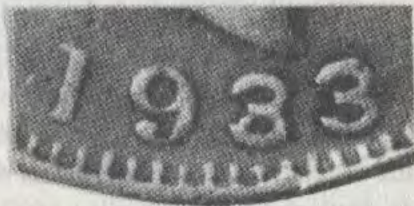
50 c. 1933, 3/2 sin M

Las primeras fueron 3; de ellas 2 con las marcas de ceca respectivas M y B y la otra de Medellín sin marca de ceca y con el primer 3 sobre un 2, semejante a la sobrefecha cruda de 1932 M 3/2 y como ésta, cruda también porque a ambos troqueles simplemente les marcaron el 3 sin la menor intención de borrar previamente el 2. Esa pieza de 50