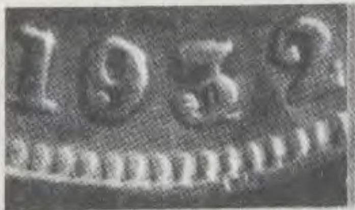
50 c. 1932 B. 93/61

Apareció pues la moneda de 1932, la hija de tantos decretos, y lo decimos en singular, la moneda, porque en ese año sólo se acuñó en Colombia la denominación de cincuenta centavos.