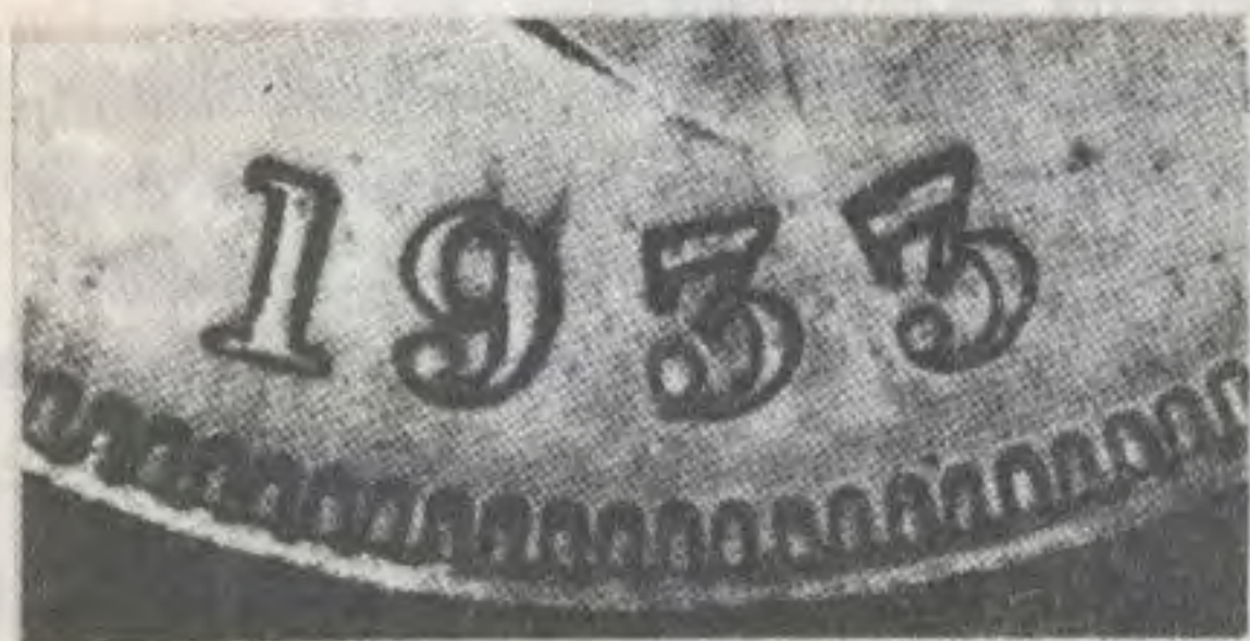
50c. 1933 de Bogotá (3 planos arriba)

A diferencia de las monedas de 1932 que requirieron tantas disposiciones legales, afanes y aplazamientos, las de 1933 parece que llegaron muy calmadamente en dos valores: 50 centavos y 20 centavos.