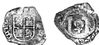
M12-1, 162_ (Cuartillo de Vellón)