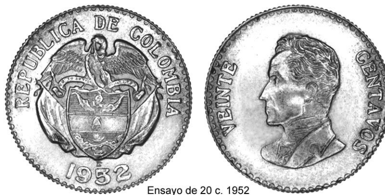
Ensayo de 20 c. 1952