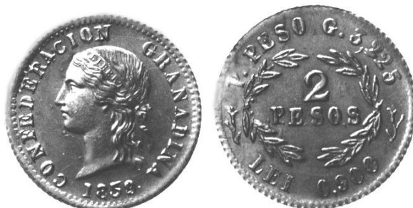
1859 2 pesos Popayán