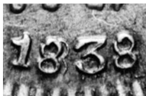
182-3a, 1838 8/8

Tipo 182-3a, 1838. Un Real, Bogotá. Primer 8 doble hacia la derecha