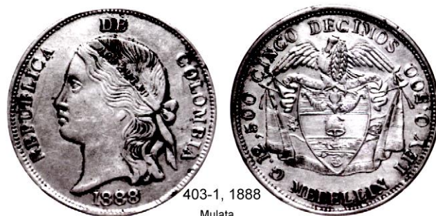
403-1, 1888 Mulata

Tipo 403-1 Mulata. Este tipo está representado por emisiones de 1888 y de 1889. Las de 1888 son escasas y las de 1889 son raras. El diseño de la efigie es muy llamativo pues se aparta radicalmente de la cara clásica tan característica de las monedas de la época que copiaban la efigie de la