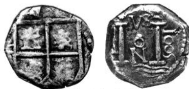
M31, 21, 1665