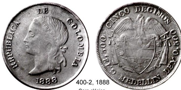
400-2, 1888 Cara clásica

Tipo 400-2 Este tipo esta constituido fundamentalmente por piezas de 1887 entre las cuales hay algunas variedades de troquel. Su relieve es débil y debido a su baja ley se manchan y desgastan fácilmente. Presentan una efigie clásica, un tanto cruda. Se conocen unas pocas piezas fechadas 1888, que son raras y participan de las mismas debilidades de las del resto del grupo.