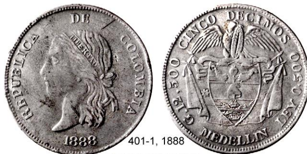
401-1, 1888 Cara alargada diferente

Tipo 401-1 Este tipo está representado por esta pieza que hasta ahora es única. Tiene una efigie cruda, alargada con una expresión peculiar. El escudo es similar al de las