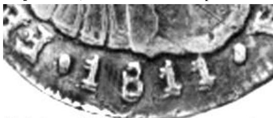
114-3a, 1811 Anv. remarcado Detalle

Tipo 114-3a, 1811. 2 Reales. Esta pieza, con todo el anverso remarcado es muy llamativa y pertenece también a la colección del ingeniero Meneses.