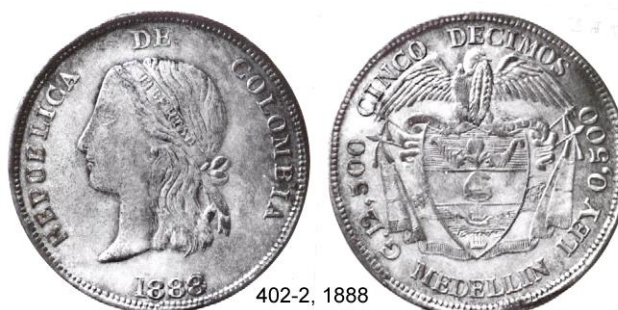
402-2, 1888 Cara larga