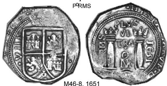
P o RMS

M14-, (1651). Cuartillo macuquino. Los diseños de Castilla y León son muy similares a los observados en una macuquina de 8 reales de ese año.