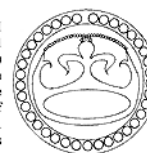
Esquema por E.Richards

Quisiera comentar igualmente que E. Richards no comparte la consideración que hizo Ullian de 19 nuevos resellos, según la nota "Chanduy wreck yields New counter stamp" publicada en Plus Vltra Vol.17,