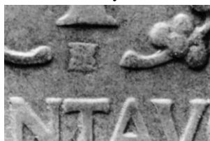
350-5a, 1954 B/B al revés