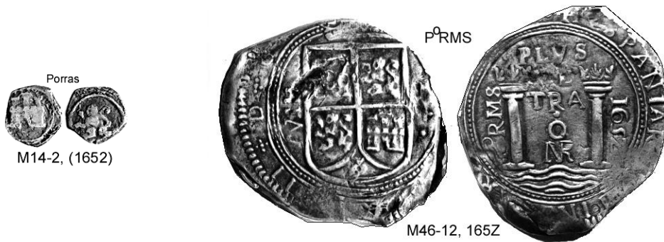
P o RMS

Castilla y León son similares a los de los 8 reales de 1652, los cuales se presentan para comparación.