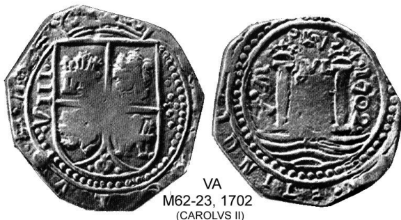
VA M62-23, 1702 (CAROLVS II)

pieza de 8 reales. Fue un placer encontrar esta moneda; la reconocí inmediatamente como la que aparece en el libro clásico de Wayte Raymond, “Pesos de Plata de Norte y Sur América”. También aparece en el libro de Restrepo y Lasser catalogada como M62-23, y en Iriarte bajo el número 1411. Es un espécimen extraordinario