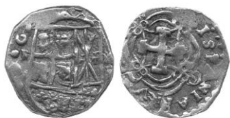
M80-12, (1732-44) Blanton Fitz Museum

II Escudos, Felipe V, 6,75gm, ensayador M por Molano. Marca de ceca F a la izquierda del escudo. Marca de ensayador M a la derecha del escudo.