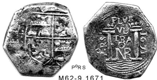
P ORS M62-9, 1671