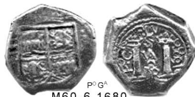
P OG A M60-6, 1680

M60-6, 1680, III Reales. Macuquina de la cual no se tenía noticia. Carlos II. Ensayador Pedro García (1678-92), cuyas iniciales P OG A , aparecen a la izquierda del pilar izquierdo. Los elementos del diseño son los mismos de la anterior. Procede del mismo grupo de monedas adquiridas recientemente por Blanton.