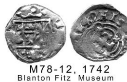
M78-12, 1742 Blanton Fitz Museum

Las macuquinas de oro de Nuevo Reino de finales de los 1600s y principios de los 1700s, tienen ciertas características que ayudan a identificarlas: El escudo es tipo Habsburgo aun cuando los Borbones alcanzaron el poder con Felipe V. El cuadrante superior izquierdo del escudo contiene, a su vez, cuatro cuadrantes rectangulares. El superior-izquierdo y el inferior derecho tienen normalmente castillos y los restantes tienen leones, correspondientes a Castilla y León. El error frecuente de invertir los cuadrantes en las piezas de Nuevo Reino está presente en tres de estas piezas. Otra característica de Nuevo Reino es la ausencia de las líneas verticales que representan a Aragón situadas a la derecha de los castillos y leones. Como se puede apreciar en estas fotos, se omiten las líneas de Aragón quedando así la X de Nápoles y Sicilia adyacente a