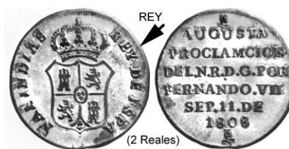
Jura de NRDG a Fernando VII