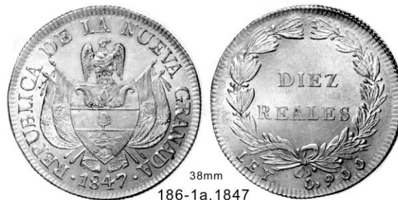
38mm 186-1a, 1847

Tipo 196-1a, 1847. 10 REALES. De mayor tamaño. Mide 38 mm en comparación con la pieza usual que mide 36.5mm. Es muy notorio el hecho de que el cóndor de la pieza grande, es más ancho. Se muestran los dos ejemplares en su tamaño real.