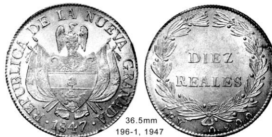
36.5mm 196-1, 1947