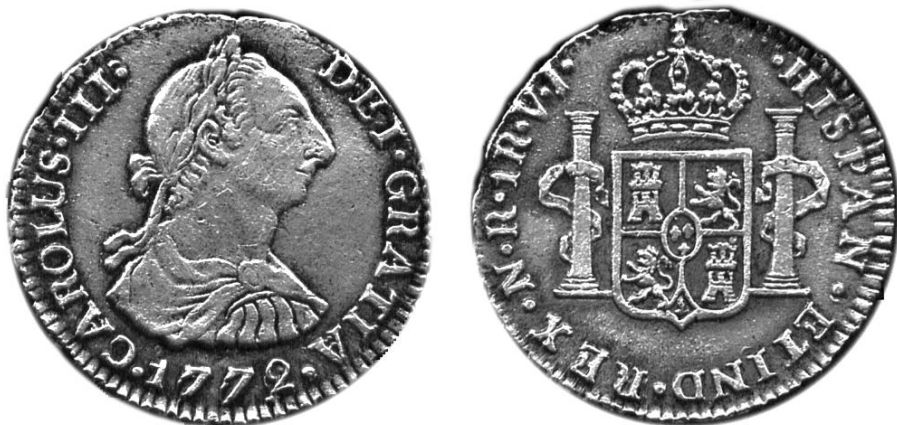
TIPO 38-1a, 1772/1772. Un Real N.R. V.J. Pesa 3,23gm. Tamaño usual 20mm.