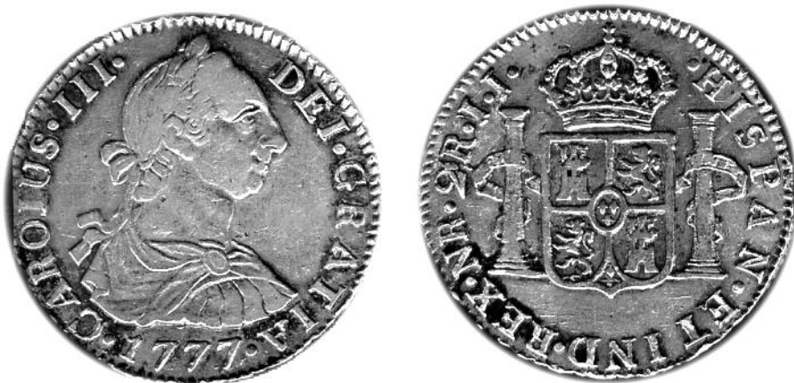
TIPO 42-6, 1777. Dos Reales NR J.J. Pesa 6,48gm. Tamaño usual 27mm.