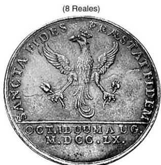
Jura de Santa Fe a Carlos III

Tipo 147-3, 1831 De esta fecha sólo se conocía un ejemplar. Este es el segundo. Ofrecido por Ponterio en su subasta 125. Ampliado x 1.5. Se subastó por mil seiscientos cincuenta dólares.