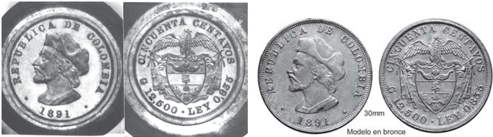
Matrices del Colón de 1891

Otra interesante pieza subastada fue un modelo en bronce para «el Colón», el cual tiene la peculiaridad de que el reverso es diferente al del diseño adoptado. Igual dibujo tiene un modelo en plata que se encuentra en el Museo Numismático del Banco de la República así como la matriz, proveniente del mismo museo, que reproducimos aquí. Los anversos tanto del modelo como de la matriz sí fueron adoptados para «el Colón Grande».