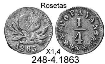
Rosetas X1,4 248-4, 1863

El artículo sobre las monedas de efigie diferente de 10 Centavos 1881/82/83 (Numisnotas 112 Pág. 7). Creo que de hecho esta serie amerita que la clasifiques en un tipo diferente. Tanto la libertad como las letras de la moneda apuntan a un troquel diferente que se repite durante tres años consecutivos. No pienso que se trate de adulteraciones ya que la moneda del 81 sólo se consigue con esta efigie y no existe la más tradicional. Excelente artículo y ojalá próximamente puedas crear un nuevo tipo! .