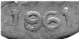
370-24a, 1961 9/6

370-24a, 1961. 5 centavos, cobre. Interesante 9 sobre 6 formando un 8.