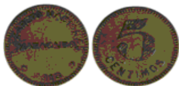
5 céntimos, 1916, Bronce, 20 mm