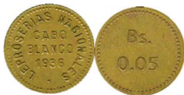
0.05 Bolívares 1936, bronce 20 mm