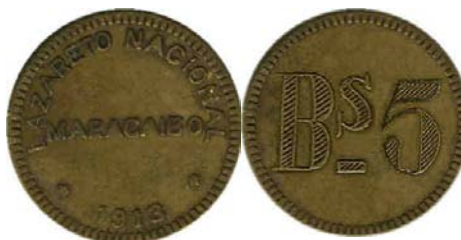
5 Bolívares, 1913 – 1916, Bronce, 29 mm.