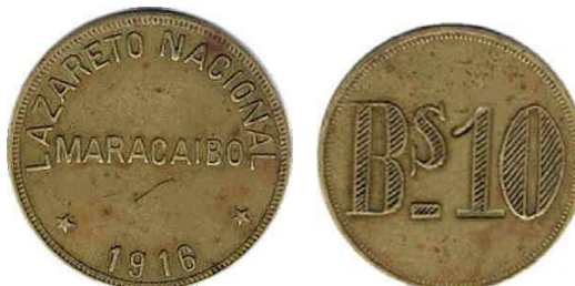
10 Bolívares , 1913 – 1916, Bronce, 32 mm