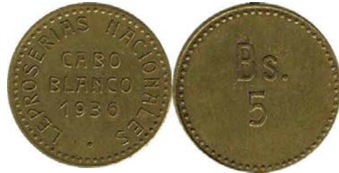
1936 Bronce 25 mm