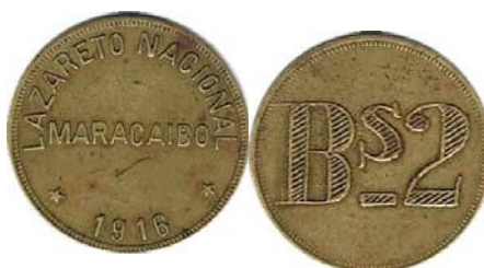
2 Bolívares, 1913 – 1916 Bronce, 25 mm