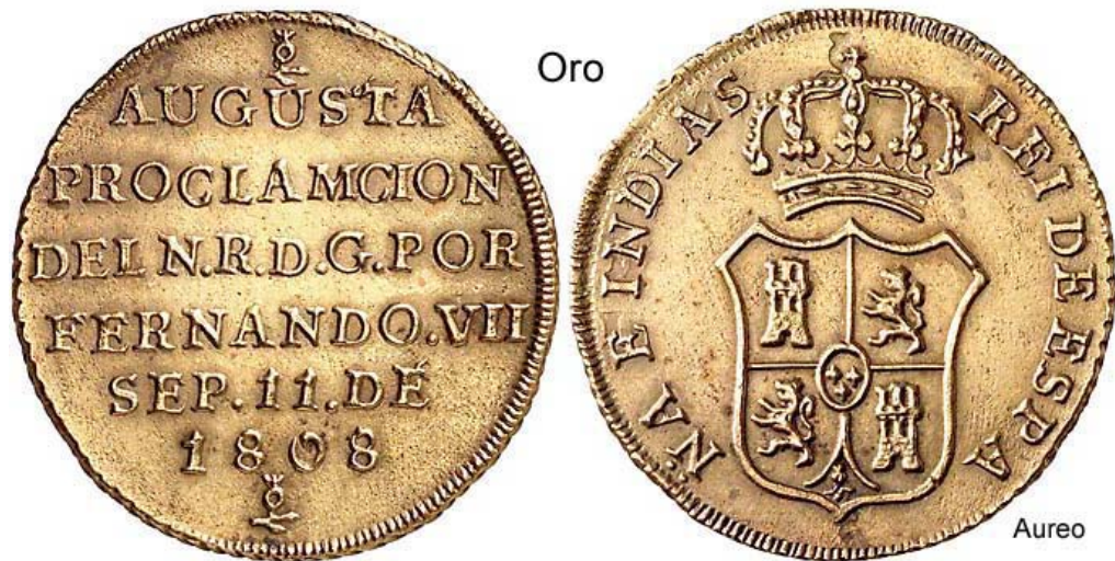
Jura en oro de Santa Fe a Fernando VII, fechada 1808. Se supone que de todas las juras se acuñaban en oro unos pocos ejemplares destinados a los grandes personajes como el rey virrey y probablemente el alférez real. Estas piezas, como es lógico son extremadamente raras. Este ejemplar fue recientemente subastado por Aureos por una suma equivalente a unos veinte millones de pesos. .