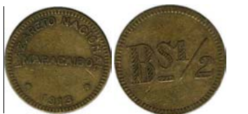
½ Bolívar , 1.913 – 1916, Bronce, 17 mm