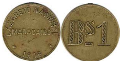
1 Bolívar , 1913 – 1916, Bronce, 22 mm