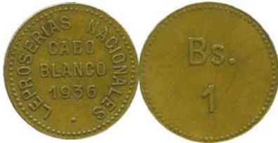
1 Bolívar 1936 Bronce 23 mm