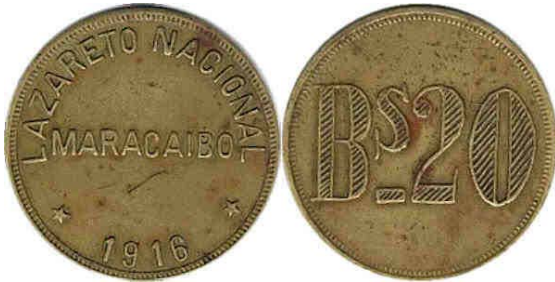
20 Bolívares, 1913 – 1916, Bronce, 34 mm