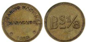
1/8 Bolívar , 1913 – 1916, Bronce, 20 mm