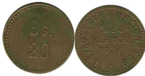
10 Bolívares, 1936, Bronce, 32 mm 20 Bolívares, 1.936, Bronce 34 mm