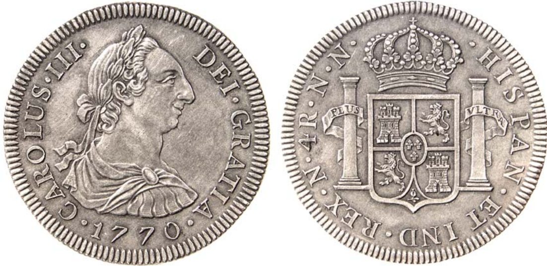
Modelo enviado de España para que sirviera como guía para la acuñación de las piezas de plata de Carlos III