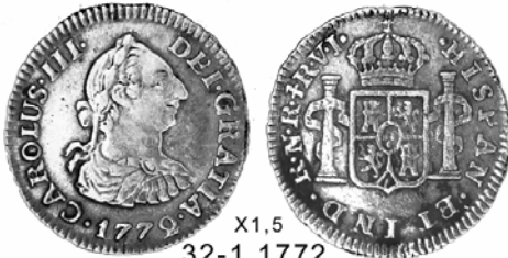
X1.5 32-1, 1772