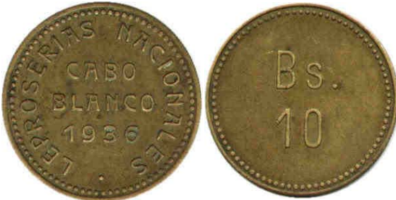
5 Bolívares, 1936, Bronce, 29 mm