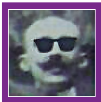
Tomado de la Revista Argentina "El Asegurado" N°199