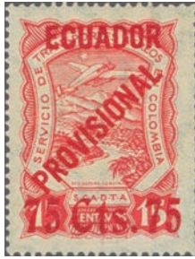
La falsificación de sellos de SCADTA-Ecuador