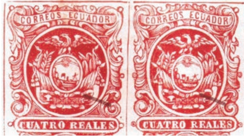
A la izquierda los falsos 2A y 2B, en la clasificación Suárez-Bongiovanni. A la derecha, el 4 reales falso en el catálogo Scott