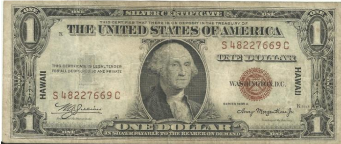
Anverso del billete de 1 dólar (colección personal del autor)

Hawaii fue anexionado a Estados Unidos en 1898 y finalmente fue admitido como estado de la Unión el 21 de agosto de 1959. El ataque a Pearl Harbor, donde existía una base naval de la Armada de los Estados Unidos en la isla hawaiana de Oahu, por parte del Imperio Japonés el domingo 7 de diciembre de 1941 provocó que Estados Unidos entrara a la II Guerra Mundial.