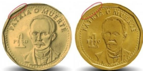
Anversos respectivos de las monedas de un peso acuñadas en 2001 (izquierda) y 2002 (derecha)

Por una parte se observa que las monedas acuñadas a partir de 2002 exhiben el poliedro que rodea los diseños de ambas caras con un grosor significativamente mayor que en el caso de las piezas acuñadas hasta 2001, inclusive.