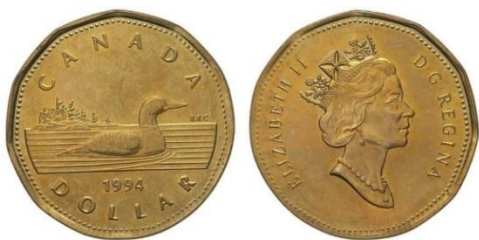
Anverso y reverso de una moneda canadiense de un dólar acuñada en 1994

Otra novedad consistió en encuadrar las composiciones de ambas caras de la moneda dentro de una orla de puntos enmarcada a su vez en un poliedro de once lados. Estos elementos habían sido ya utilizados en las monedas canadienses de un dólar que la Real Casa de la Moneda de Canadá había comenzado a producir en 1987. Las monedas, conocidas popularmente como "loonies" en alusión al tipo de ave que figura en el anverso, fueron acuñadas utilizando cospeles suministrados por la empresa Sherritt. Se da la circunstancia que la citada empresa también suministró los cospeles para la producción de, al menos, las monedas cubanas de tres pesos de 1992. Si bien todo podría deberse a una sorprendente casualidad, lo cierto es que el parecido entre los referidos elementos del diseño empleados en los "loonies" canadienses y las piezas cubanas de un peso resulta significativo.