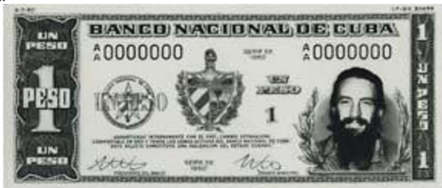
Anverso propuesto por la “Security Banknote Co.” en 1960 para el billete de un peso

unos meses antes, el 20 de octubre de 1959. El escudo nacional se dispuso en el centro del anverso flanqueado a su derecha por la denominación sobreimpresa al anagrama del Banco Nacional de Cuba. El nombre de esta institución bancaria se imprimió también en la parte superior del campo del billete mientras que la inferior llevaría las firmas del Presidente del Banco Nacional y del Primer Ministro de la República.