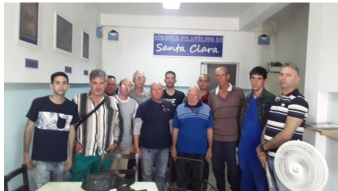
Círculo Numismático de Villa Clara