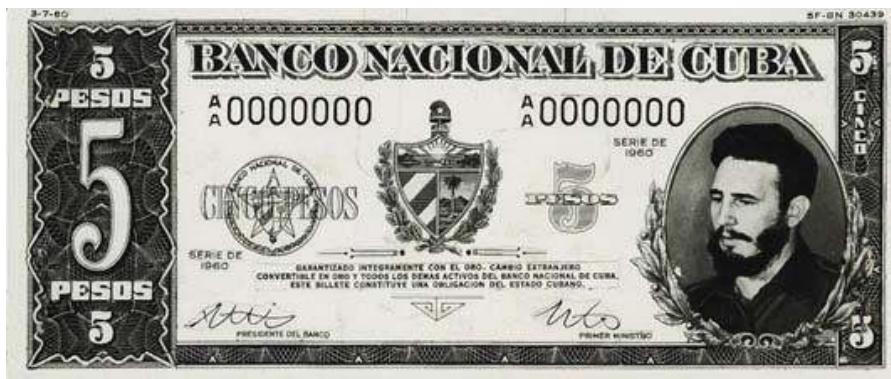
Anverso propuesto por la "Security Banknote Co." en 1960 para el billete de cinco pesos

Por su parte el billete de cinco pesos sería prácticamente idéntico al descrito con anterioridad, excepto en llevar grabada a la izquierda la imagen del Comandante en Jefe Fidel Castro, quien desde el 16 de febrero de 1959 ostentaba el cargo de Primer Ministro de la República de Cuba. El diseño se basó en una fotografía del líder tomada durante un discurso y fue preciso retocarla para eliminar su mano derecha sosteniendo el micrófono. A diferencia del billete de un peso, este sería de color negro.