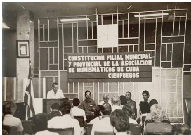
Constitución de la ANC en Cienfuegos

Cienfuegos ha sido y es una importante plaza del coleccionismo numismático que agrupó a los antiguos integrantes de la antigua y actual Asociación. Los que han fortalecido sus colecciones con piezas como tokens de la industria azucarera que rodeó la ciudad, así como la existencia del punto marítimo que permitió un cuantioso circulante monetario por los comerciantes y