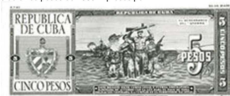
Reverso propuesto por la “Security Banknote Co.” en 1960 para el billete de cinco pesos

Según la documentación que acompañaba la propuesta el billete de un peso sería de color azul y mediría 143x61 centímetros. Es decir, un tamaño muy similar al de los billetes de cinco pesos de 1960 impresos por la firma “Thomas de la Rue”.