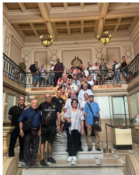
Participantes en el Encuentro Nacional de Numismática