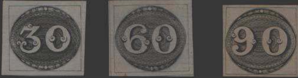
Primeiros selos do Brasil - emitidos em 1º de agosto de 1843.