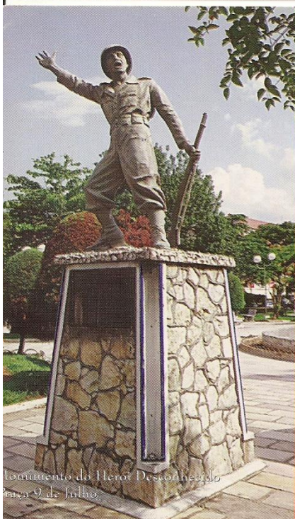
Monumento do Herói Desconhecido Praça 9 de Julho