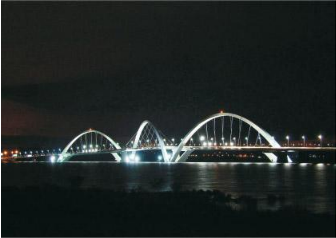
*CROÁCIA – 19.03.2010, Páscoa (3,10 Kn).