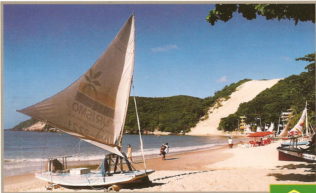
Ponta Negra - Natal - RN