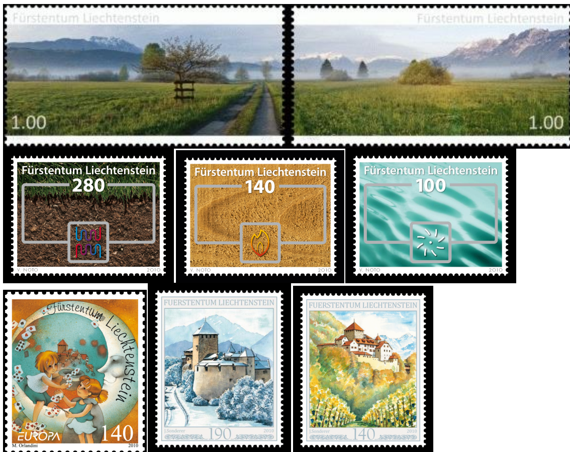
*LIECHTENSTEIN- 03.09.2010, a) Europa 2010 – Livros Infantis (CHF 1.40); b)Panorama e Liechtenstein: Tallandschaft Ost and Tallandschaft West (2 x CHF 1.00); c)Energia Renovável (CHF 1.00, 1.40 e 2.80); d)