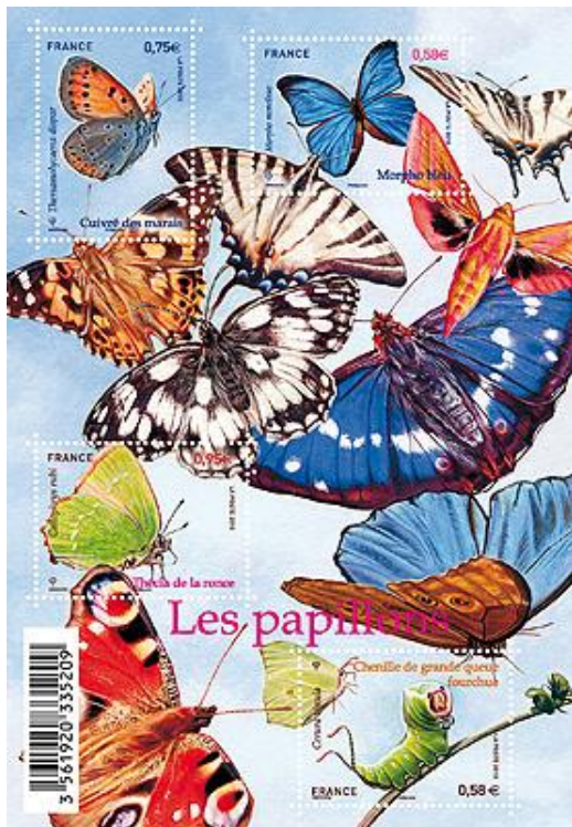
*FRANÇA- 06.09.2010, Borboletas (minifolha, 2xEUR 0.58, EUR 0.75 e EUR 0.95).