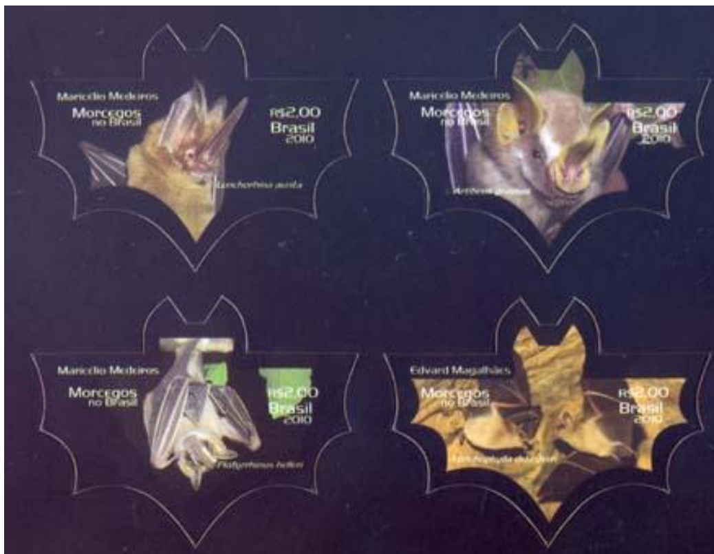
30.10.2010, Morcegos – Famílias que ocorrem no Brasil (4xR$ 2,00).