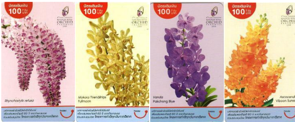
*TAILÂNDIA- Happy Card- 2010, Orquídeas (série de 9 cts. com valor facial de 100 Thai baht cada).