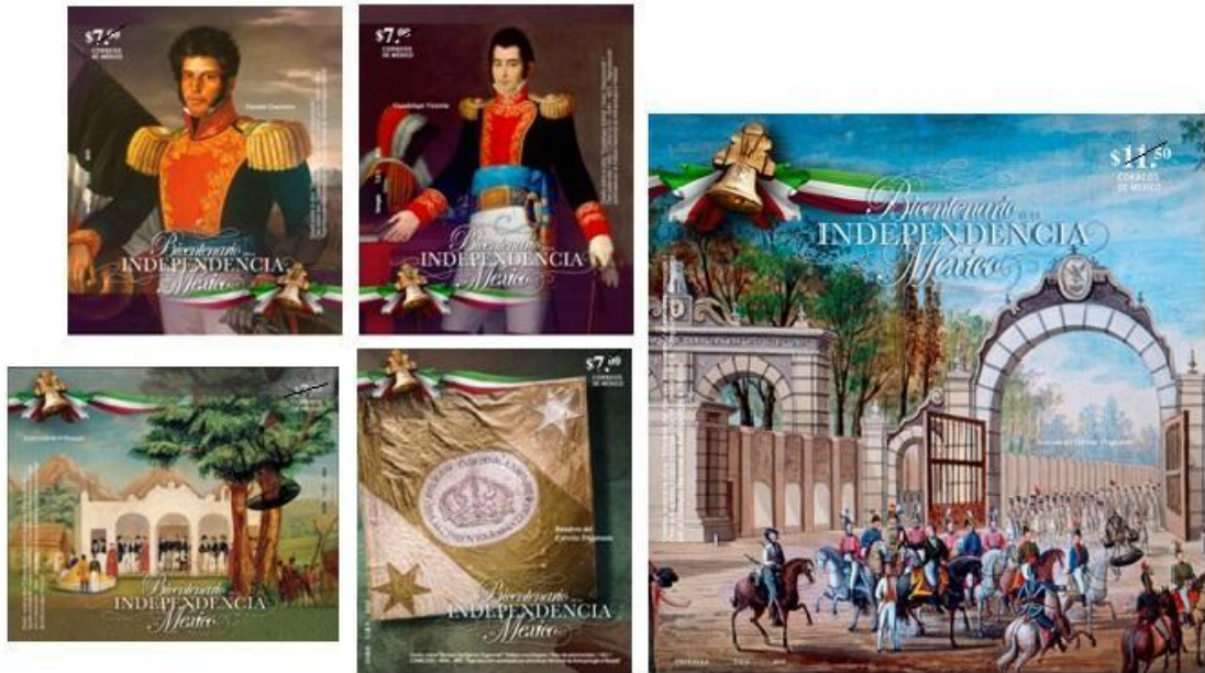
SERIE DE ESTAMPILLAS POSTALES BICENTENARIO DE LA INDEPENDENCIA DE MÉXICO

*MÉXICO- 16.09.2010, Bicentenário da Independência do México (4x$7.00 e $11.50).