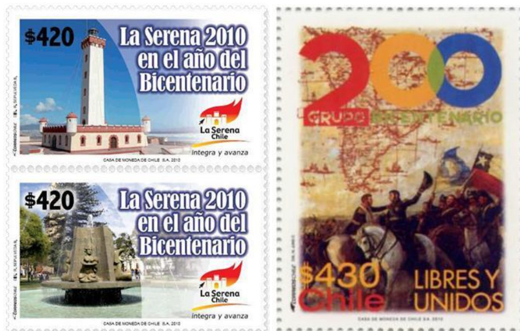
*CHILE- 10.09.2010, Bicentários das Independências da América Latina ($430). 15.09.2010, La Serena saúda o Bicenténario (2x$420).