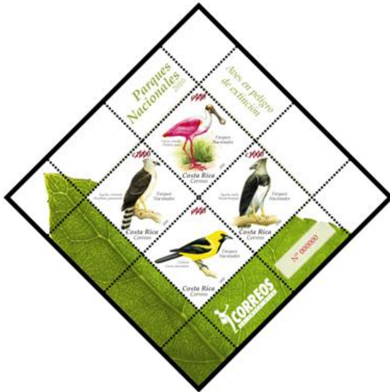
*COSTA RICA- 24.08.2010, Parques Nacionales 2010, Aves em Perigo de Extinção (2x400 Colones e 2x1000 Colones).