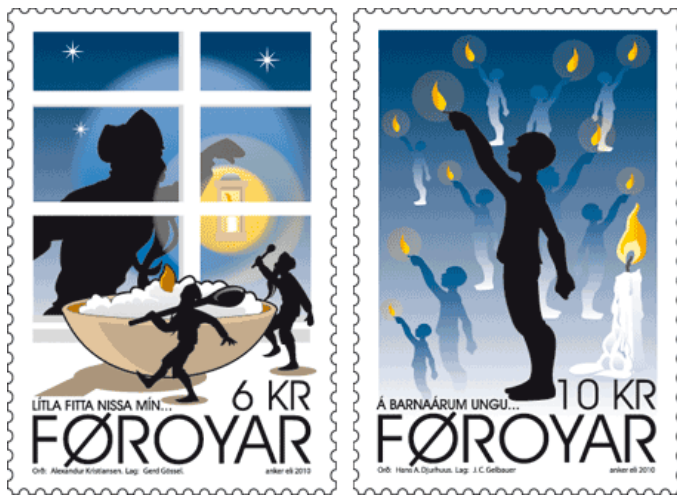
*FAROÉ- 20.09.2010, Cânticos Natalinos (DKK 6.00 e 10.00).