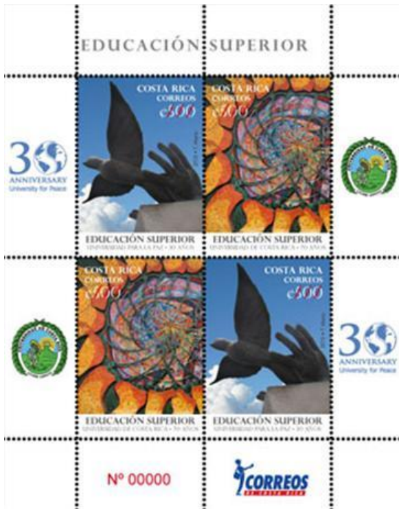
*COSTA RICA- 26.08.2010, Educação Superior: 30 Anos da Universidade para a Paz (4x C/.500).