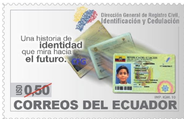
*EQUADOR- 29.10.2010, 100 Anos do Registro Civil.