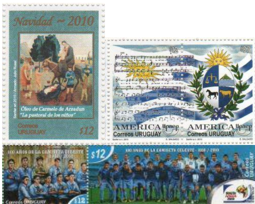
URUGUAI- 29.10.2010, Natal 2010 ($12). 08.11.2010, Série América UPAEP – Símbolos Pátrios ($12 e $37). 15.11.2010, 100 Anos da Camiseta Celeste (2x$12).