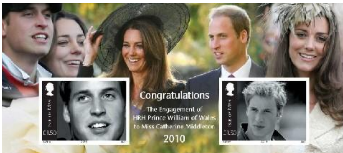
*ILHA DE MAN- 26.11.2010, Noivado Real de SAR Príncipe William of Wales com a Srta Catherine Middleton (bloco, 2xL 1.50). A Ilha de Man, pequena Dependência da Coroa do Reino Unido, saiu na frente ao comemorar filatelicamente o compromisso do príncipe herdeiro britânico com sua bela escolhida.