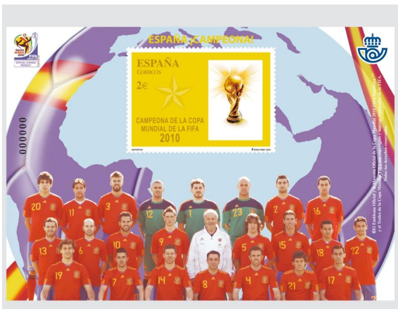
*ESPANHA- 21.10.2010, Espanha, Campeã do Mundo de Futebol (bloco, € 2).

*BÓSNIA E HERZEGOVINA – Correio Croata de Mostar- 06.10.2010, Dia Internacional de Proteção dos Habitats (2x1.00 BAM). 09.10.2010, Tesouro etnológico – calçado camponês de Herzegovina (0.70 BAM). 01.11.2010, Fauna 2010: lagarto verde dos Balcãs (4x0.50 BAM) e Flora 2010, Cogumelos (2x2.10 BAM).