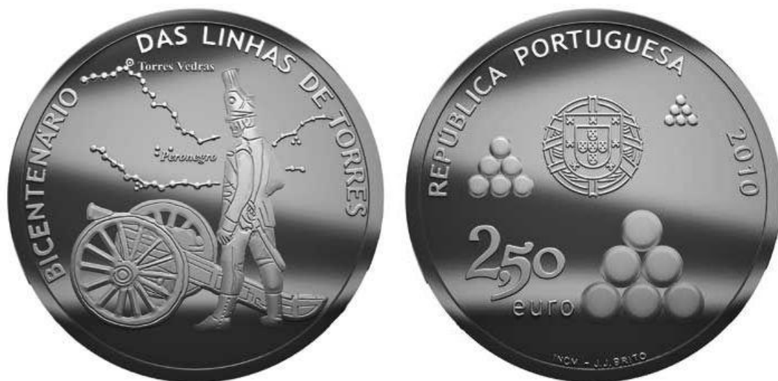
*PORTUGAL- Nov/2010, Bicentenário das Linhas de Torres – Moeda de € 2,50 – metal: cuproníquel 75/25; acabamento: normal; diâmetro: 28mm; peso: 10g; bordo: serrilhado; produção: 75.000 peças.