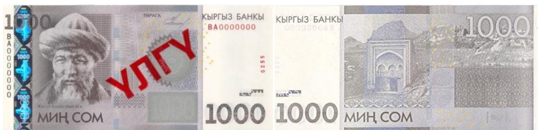
*QUIRGUISTÃO (REPÚBLICA QUIRGUIZ) – 01.12.2010, novas cédulas de 200, 500 e 1000 som.