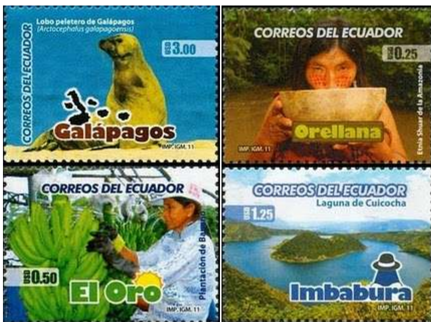
*EQUADOR- 24.01.2011, Série Equador Diverso – 7ª parte ($0.25, $0.50, $1.25 e $3.00).