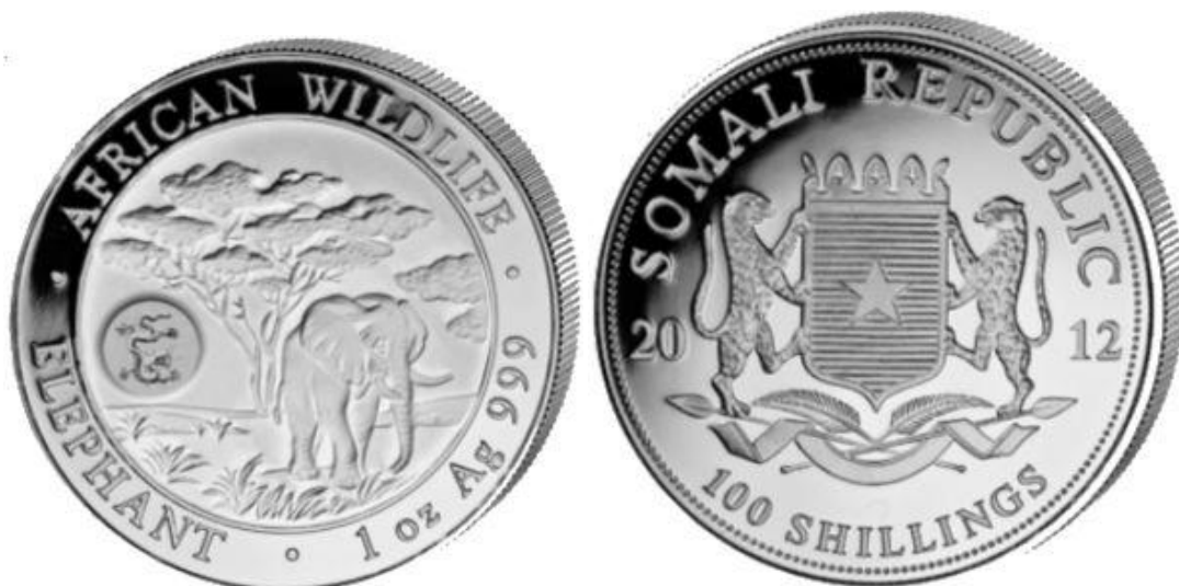
*SOMÁLIA- 2012, Fauna da África – elefante. Moeda de 100 shillings – material: prata 999/1000; peso: 31,1g; diâmetro: 38,6mm.