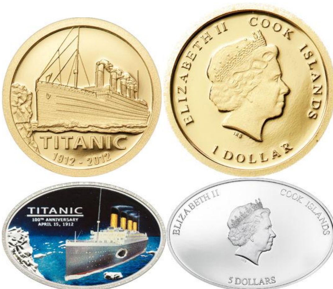
*ILHAS COOK- 2012, Moedas comemorativas aos 100 anos do naufrágio do Titanic. Moeda de um dólar das Ilhas Cook – material: ouro; peso: 0,5g; diâmetro: 11mm; produção: 15.000 peças proof. Moeda de $5 – material: prata; peso: 12g; diâmetro 30mm; formato: elipse 30x45mm; produção: 2.012 proof.