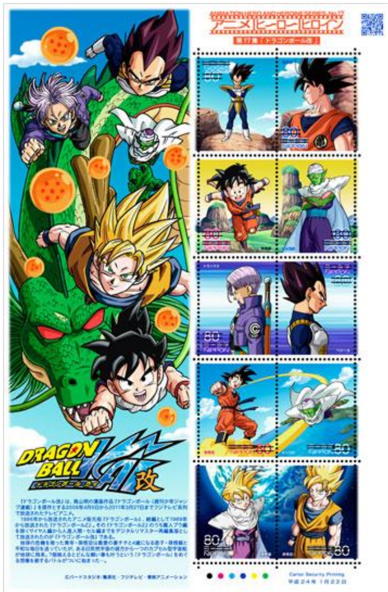
*JAPÃO- 23.01.2012, Série Desenhos Animados – Dragon Ball Kai (10 x 80 yen).