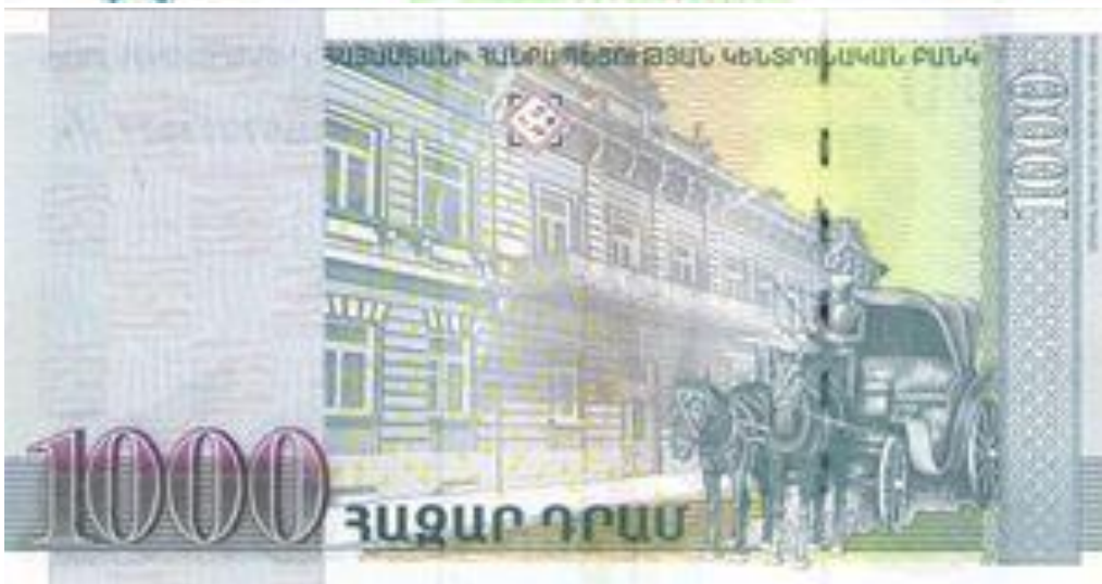
*ARMÊNIA- 2011, Cédula de 1000 Drams.