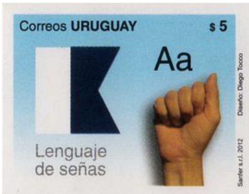
*URUGUAI- 31.01.2012, Artesanato do Uruguai (5 x $1). 09.02.2012, Linguagem de Sinais ($5).