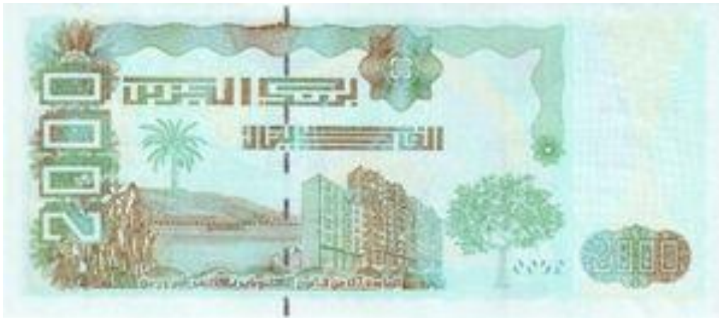
*ARGÉLIA- 2011, cédula de 2.000 Dinars.