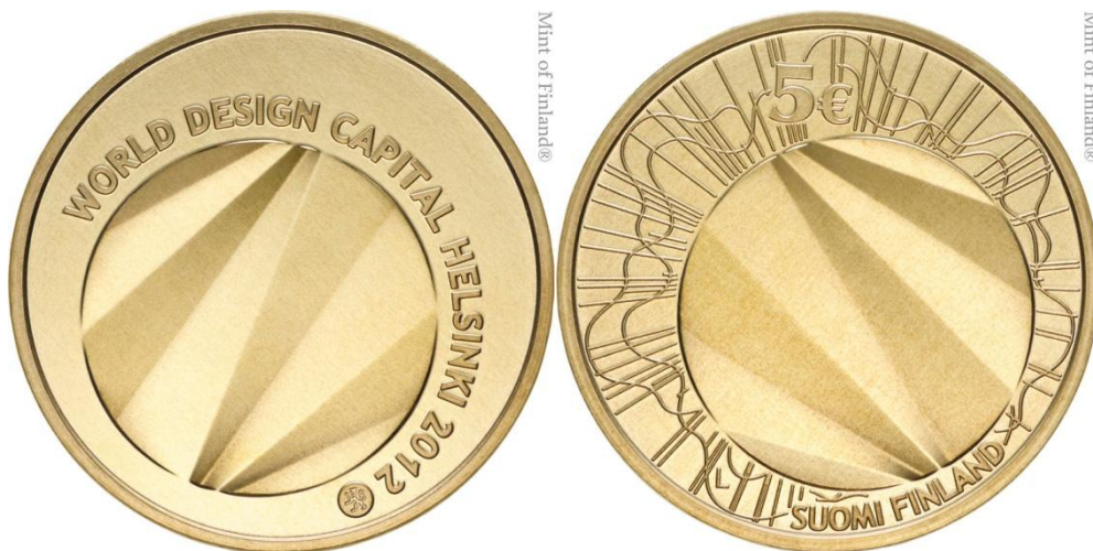
*FINLÂNDIA- 2012, Helsinki, Capital Mundial do Design 2012 – Moeda de €5.