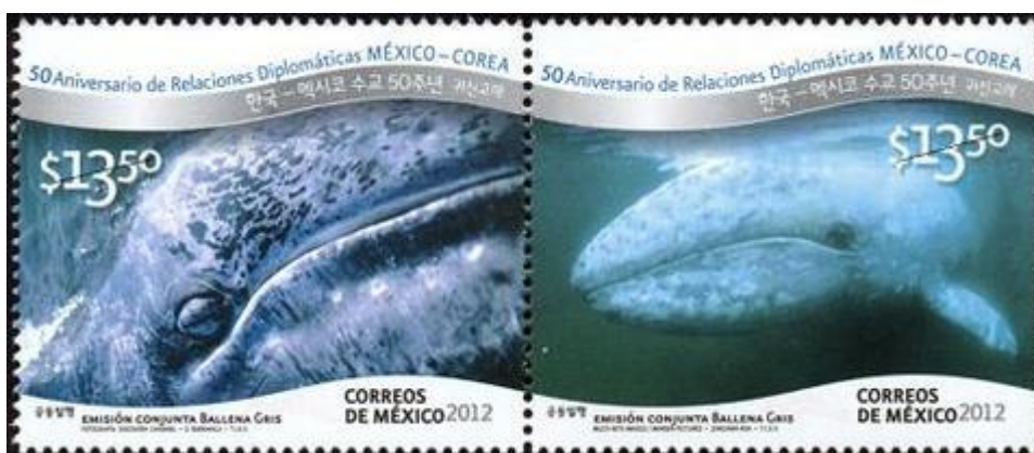
*MÉXICO- 26.01.2012, Emissão conjunta México-Coréia – Baleias gris (2 x $13.50).