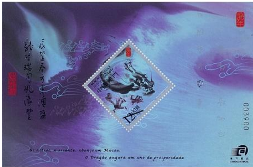
*MACAU- 05.01.2012, Ano Lunar Chinês do Dragão (4 x 1.50 patacas e 5.00 patacas; bloco, 12.00 patacas).