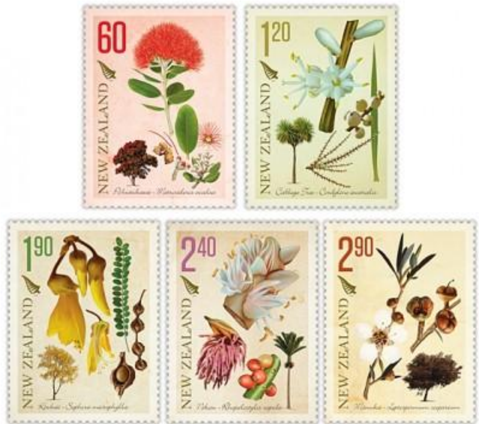
*NOVA ZELÂNDIA- 01.02.2012, Árvores Nativas da Nova Zelândia (60c, $1.20, $1.90, $2.40 e $2.90).