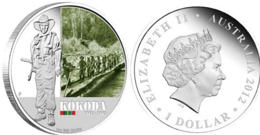
*AUSTRÁLIA- 2012, Batalha de Kapyong e Batalha de Kokoda – Moedas de um dólar australiano – material: prata; peso:31,1g; diâmetro: 40,6mm; produção: 5.000 peças proof.