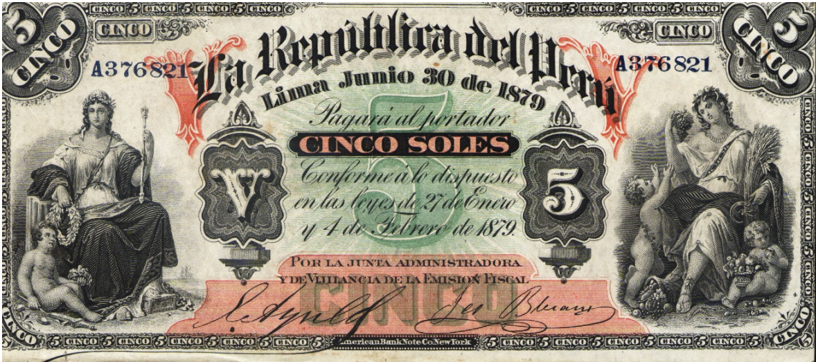
Cinco soles, La República del Perú – 1879

Cinco pesos de El Banco del Cauca (resellado por el Banco del Estado). Cali 188. Serie B. Pick 472.