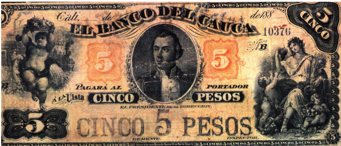
Cinco pesos, Banco del Cauca – 188.

Cinco pesos de El Banco del Cauca (resellado por el Banco del Estado). Cali 188. Serie B. Pick 472.