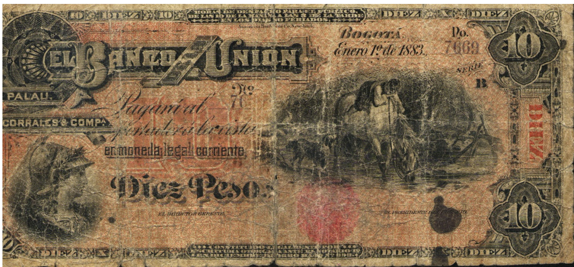
Diez pesos Banco de la Unión (Bogotá) – 1883

Diez pesos: Anverso. El Banco de la Unión de Palau, Corrales & Compañía pagará al portador a la vista en moneda legal corriente diez pesos. Bogotá 1 de enero de 1883. Serie B. Cuatro dígitos. Viñeta izquierda, alegoría a la libertad; viñeta derecha: hombre a caballo junto a un río y un perro como acompañante. Colores: fondo rojo; letras, viñetas y dibujos en negro. Resellado por el Banco Nacional. Horas de despacho para el público, de las 10 de la mañana a las 3 de la tarde en los días no feriados. Sin firmas. Reverso. Resello: Este billete circula provisionalmente como billete del Banco Nacional de acuerdo con el Decreto no. 517 del 30 de octubre de 1899. Miembros de la Junta de Emisión, cuatro firmas. Color rojo. Pick 862.