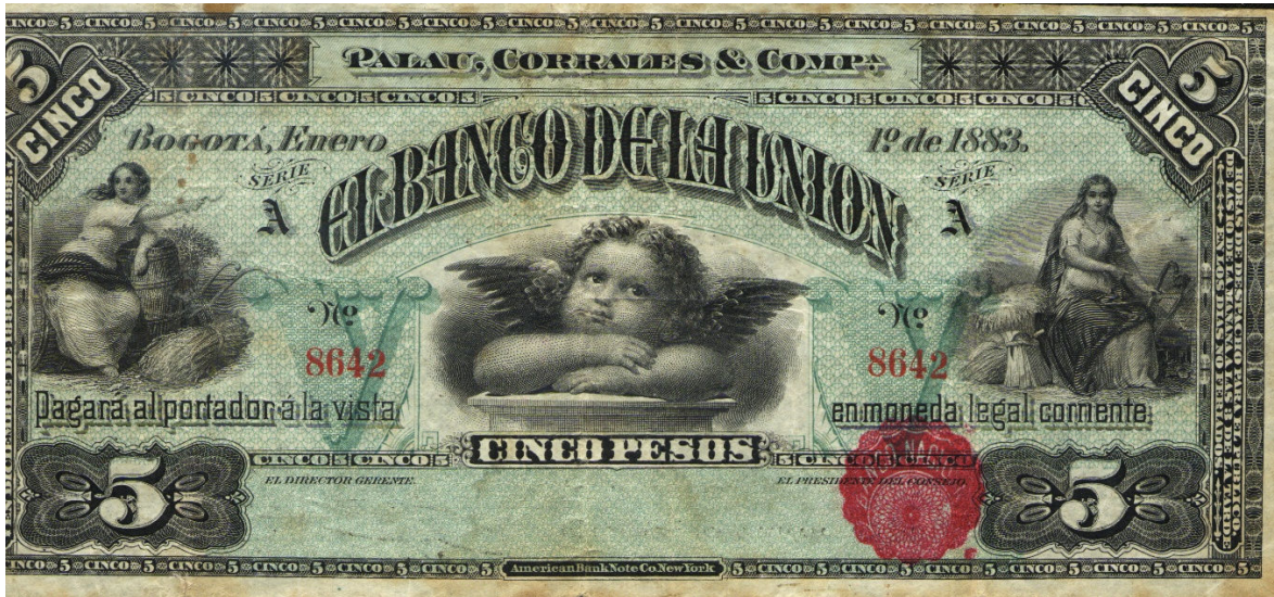
Cinco pesos, Banco de la Unión (Bogotá) – 1883

Diez pesos: Anverso. El Banco de la Unión de Palau, Corrales & Compañía pagará al portador a la vista en moneda legal corriente diez pesos. Bogotá 1 de enero de 1883. Serie B. Cuatro dígitos. Viñeta izquierda, alegoría a la libertad; viñeta derecha: hombre a caballo junto a un río y un perro como acompañante. Colores: fondo rojo; letras, viñetas y dibujos en negro. Resellado por el Banco Nacional. Horas de despacho para el público, de las 10 de la mañana a las 3 de la tarde en los días no feriados. Sin firmas. Reverso. Resello: Este billete circula provisionalmente como billete del Banco Nacional de acuerdo con el Decreto no. 517 del 30 de octubre de 1899. Miembros de la Junta de Emisión, cuatro firmas. Color rojo. Pick 862.