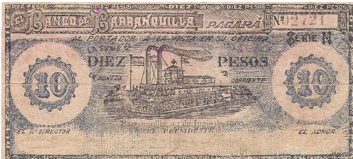
Diez pesos, Banco de Barranquilla, 1900.

Diez pesos. Anverso: el Banco de Barranquilla pagará al portador a la vista en su oficina la suma de diez pesos en moneda corriente. Barranquilla 17 de junio de 1900. Serie N. 5 dígitos. El 2º director, el presidente, el Admor. Pick 255