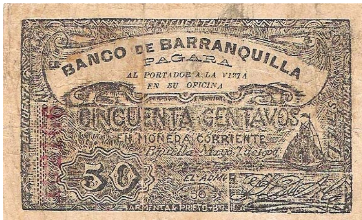
Cincuenta centavos, Banco de Barranquilla, 1900.