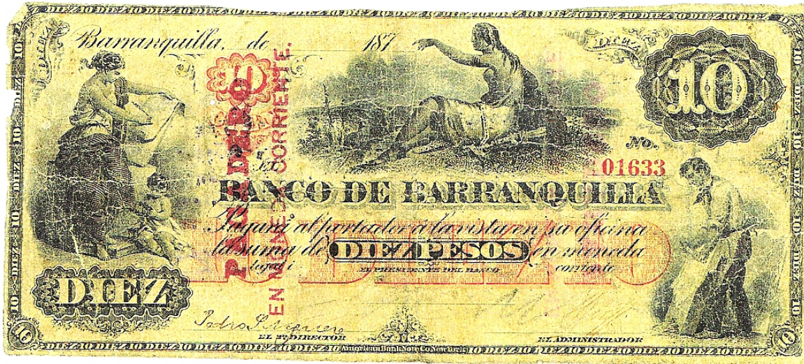
Diez pesos, Banco de Barranquilla, 187.

De la segunda emisión tenemos los siguientes: