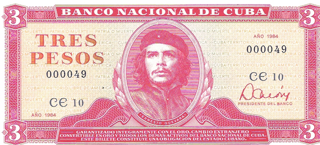
Tres pesos, Banco Nacional de Cuba, 1984.

Para el pago de toda obligación contraída o a cumplir en el territorio nacional". Pick 107.