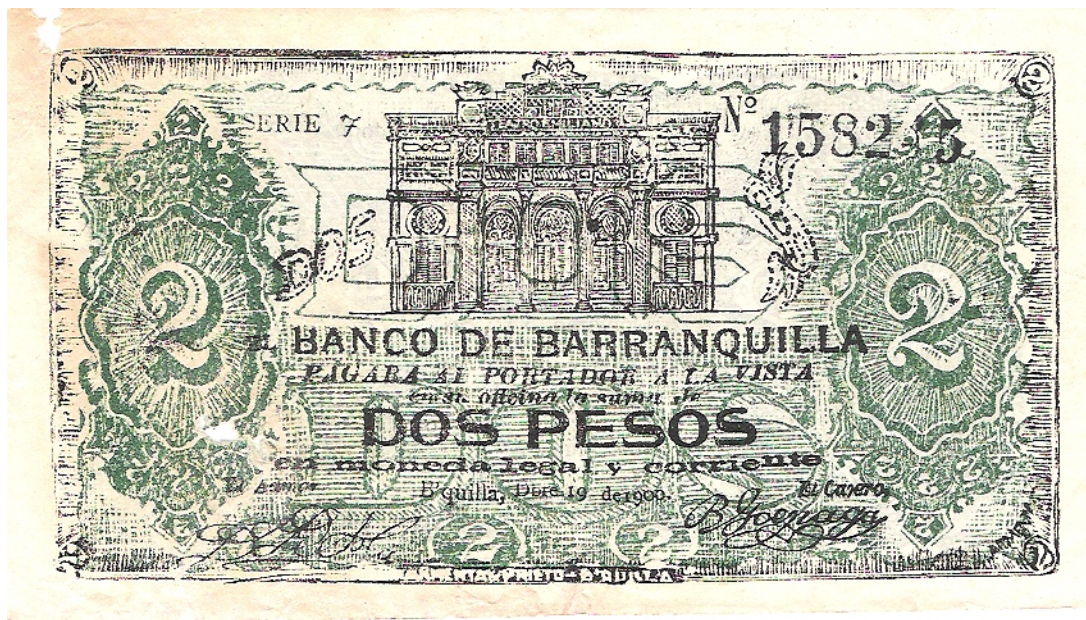
Dos pesos, Banco de Barranquilla, 1900.

Dos pesos. Anverso: el Banco de Barranquilla pagará al portador a la vista en su oficina la suma de dos pesos. Barranquilla Dbre. 19 de 1900. Serie 7. 6 dígitos. Reverso: leyenda igual a la del anterior. Pick 251.