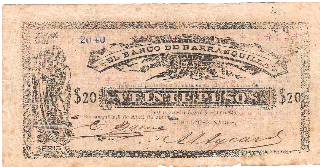
Veinte pesos, Banco de Barranquilla, 1900.

Veinte pesos. Anverso: el Banco de Barranquilla pagará al portador a la vista en su oficina la suma de veinte pesos. Barranquilla 5 de abril de 1900. Serie G. 4 dígitos. Los comisionados. Dos firmas. Como dato curioso, anotamos que este billete fue impreso en papel sellado de la época. Pick 257.