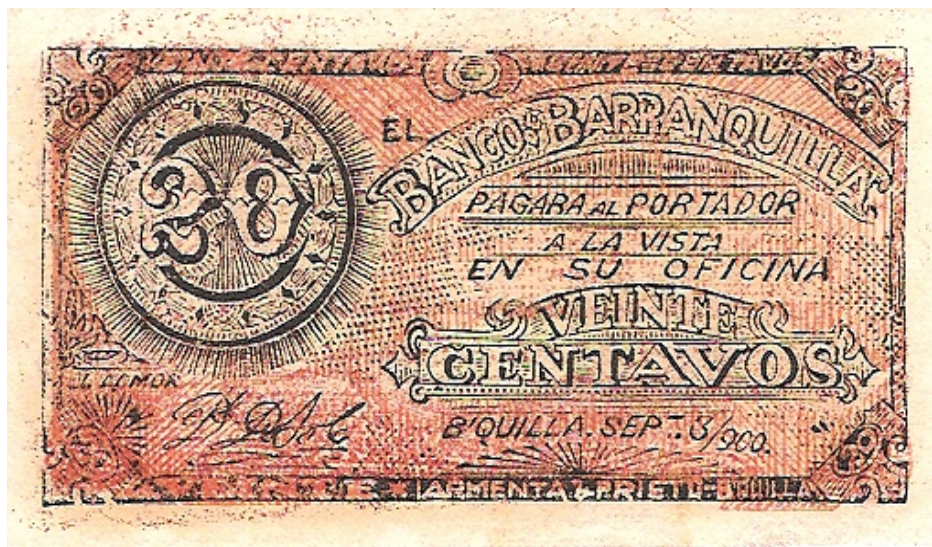
Veinte centavos, Banco de Barranquilla, 1900.

Veinte centavos. Anverso: El Banco de Barranquilla pagará al portador a la vista en su oficina veinte centavos. Barranquilla sept. 3/900. Reverso: este billete de curso forzoso en todo el departamento inconvertible y circula bajo la responsabilidad del gobierno nacional según contrato de sept. 3 de 1900. El Jefe Civil y Militar del Dpto., Próspero Carbonell. Color rojo. Pick 242.