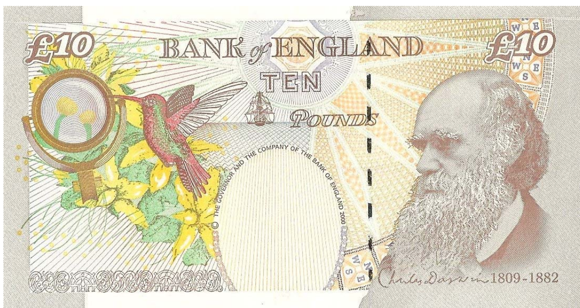
Banco de Inglaterra, diez libras (Charles Darwin)

Son numerosas las celebraciones que se adelantarán durante todo en el año en muchos países y numerosas también las discusiones que se continuarán presentando en torno a la vigencia de sus postulados. En este boletín también nos sumamos al reconocimiento de la vida y obra de este personaje, y por ello, hemos querido mostrarles el billete de diez libras esterlinas de Inglaterra (cortesía del señor Efrén Serrano), en el cual vemos por el reverso, la imagen imponente de Darwin en sus años de madurez, acompañado de una lente de aumento y de muestras de la flora y fauna que descubrió en sus múltiples viajes.