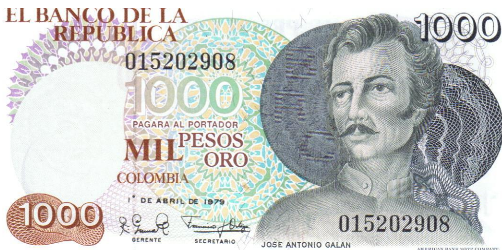
Banco de la República, mil pesos 1979 (José Antonio Galán)

El Banco de la República le rinde un merecido homenaje a este gran mártir de nuestro proceso de independencia, al ilustrar uno de sus billetes de curso legal con la imagen de José Antonio Galán, se trata de la emisión de billetes de mil pesos, del 1 de abril del año 1979. Pick 421. Este billete es conmemorativo, sólo salió en esta fecha.