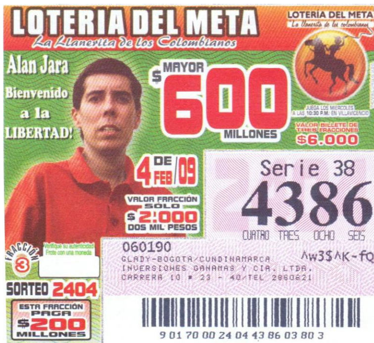
Billete de la Lotería del Meta, sorteo No. 2404 (4 de febrero de 2009)

fue liberado por el grupo insurgente de las FARC, después de más de siete años de cautiverio. Estas liberaciones nos han devuelto la esperanza para poder ver muy pronto en libertad a todas las personas que aún permanecen retenidas. Dado el gran impacto que generó este evento, quisimos sumarnos a esa ruta de la libertad y congratularnos con la libertad, que esperamos nos abrace a todos.