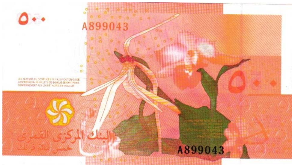
Banco Central de Comoras, 500 francos comoranos, 2006 (anverso y reverso)