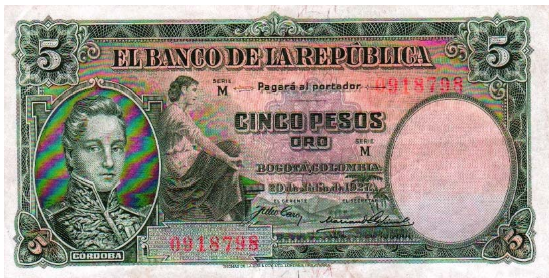
Banco de la República, cinco pesos, 1927

de la República en Bogotá. Tiene unas fibrillas multicolores como elemento de seguridad.