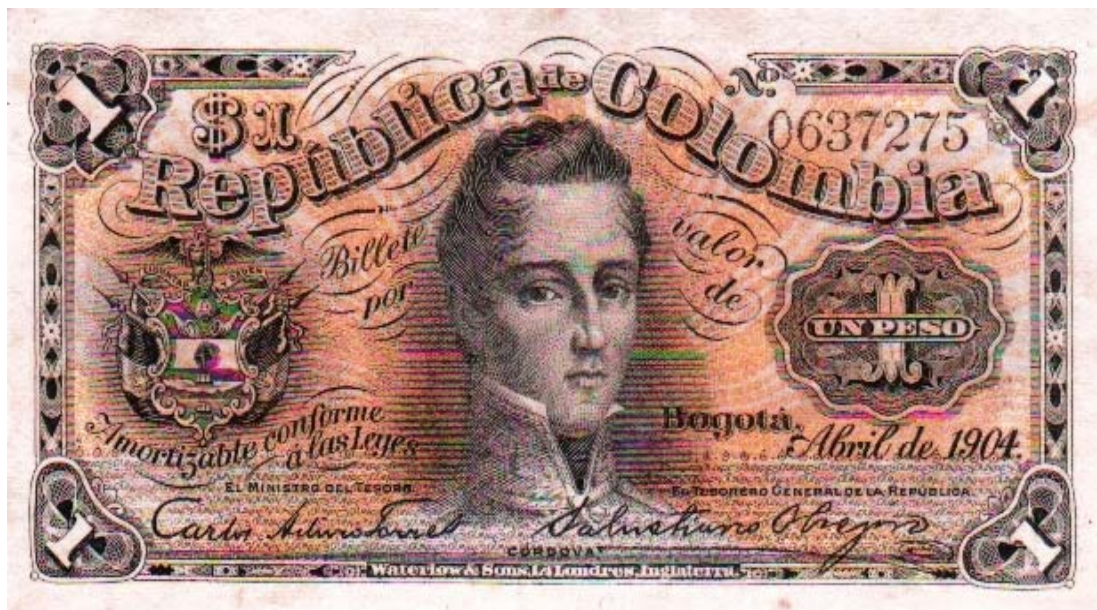
República de Colombia, 1 peso, 1904

En la numismática, José María Cordova ha sido homenajeado en varias ocasiones, tanto en billetes como en monedas y medallas. El primer billete con su imagen salió en el año de 1904, en el valor de un peso de la República de Colombia.