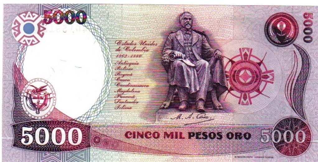
Banco de la República, 5000 pesos, 1986 (Reverso: Miguel A. Caro)

Para recordar el centenario de la muerte de Miguel Antonio Caro, hemos querido reseñar la única pieza numismática que lo exalta. En el año de 1986, salió a circulación, por primera vez, una especie monetaria de cinco mil pesos, que conmemoraba el centenario de la Constitución de 1886. En esa emisión, por el reverso, se destaca como motivo principal, un grabado de la estatua sedente de Miguel Antonio Caro, obra del escultor francés Henri Charles Pourquet, inaugurada en 1917, la cual se encuentra actualmente en el pórtico del edificio de la Academia Colombiana de la Lengua, en Bogotá. De esta billete salieron varias fechas, impresos en diferentes entidades: la primera, en la Bundesdruckerei (Imprenta Federal de Alemania); la segunda, en el Instituto Poligráfico E Zecca Dello Stato (Roma); y la tercera, a partir de 1990, en la imprenta del Banco de la República de Bogotá.