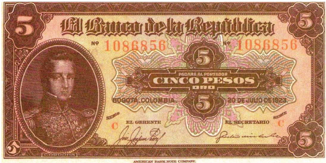
Banco de la República, cinco pesos, 1923

A partir de la primera emisión del Banco de la República, el valor de cinco pesos fue destinado a Córdoba. El segundo billete apareció el 1 de enero de 1926. Con este mismo diseño, a excepción del billete de 1927, continuó saliendo hasta el año de 1950.