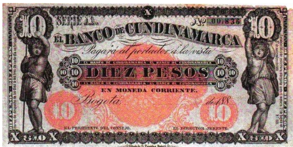
Banco de Cundinamarca, diez pesos, 188.

Es muy poco lo que sabemos sobre la existencia de este banco, el cual, al parecer, no fue de los más importantes de este periodo. Sólo tenemos como testimonio de su existencia, la emisión de billetes que realizó en el año de 1881, compuesta por valores de cincuenta centavos (pick 407), cinco pesos (pick 411) y diez pesos (pick 412). Todas estas piezas son sumamente raras. Publicamos la imagen del de 10 pesos, tomada del Libro Azul La Moneda en Colombia , de Antonio Hernández Gamarra, editado por Villegas Editores. El mismo, tiene la siguiente descripción: Bogotá 188. Serie A No. 00,836. Impreso por la litografía D. Paredes de Bogotá. Este ejemplar reposa en la colección numismática de la Casa de Moneda de Bogotá.