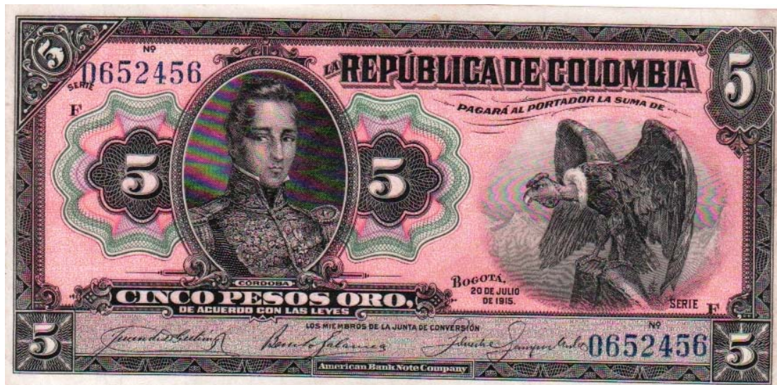
República de Colombia, cinco pesos, 1915