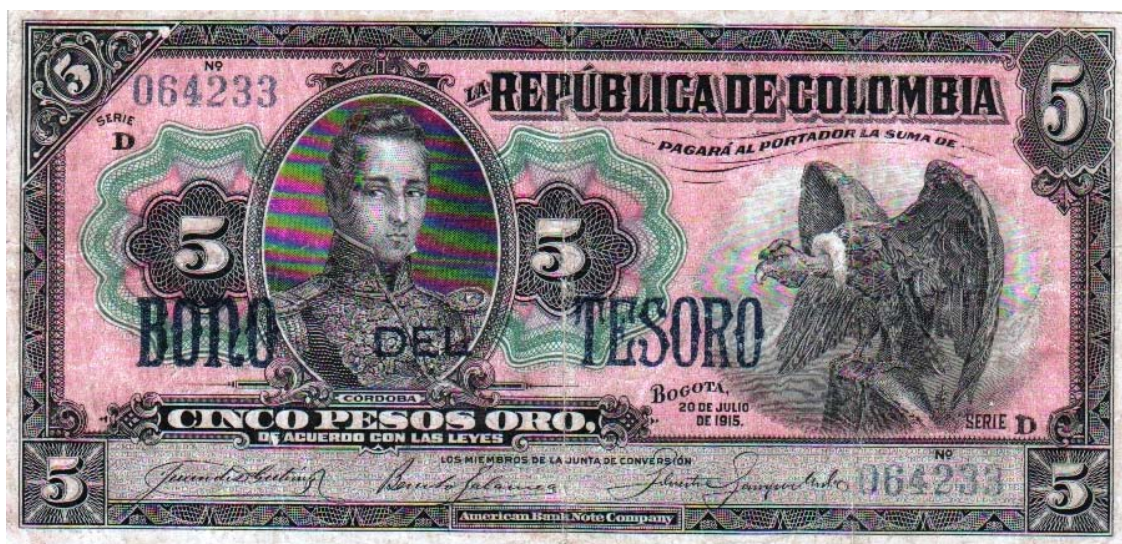
República de Colombia, cinco pesos, 1915 (Bono del Tesoro)

José María Córdova apareció por primera vez en un billete emitido por el Banco de la República, en el valor de cinco pesos de la serie de 1923.