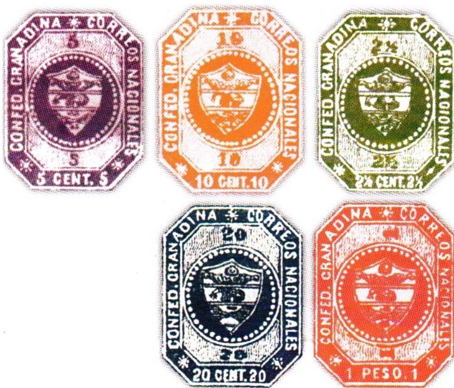
Primera serie postal de sellos de correos de Colombia, 1859