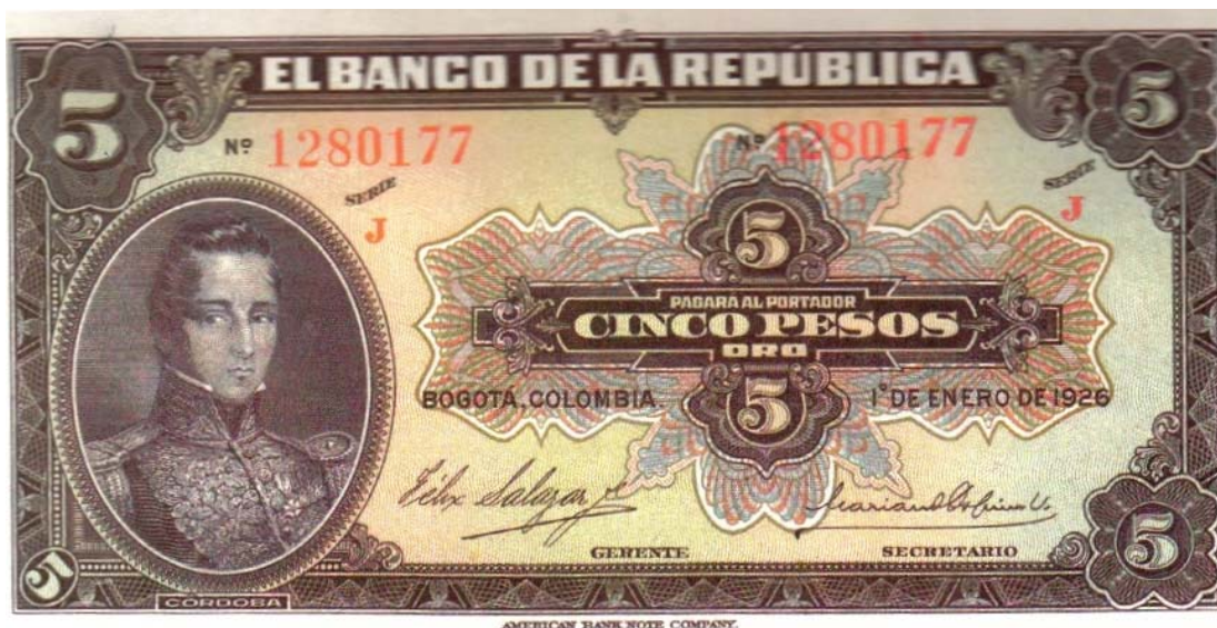
Banco de la República, cinco pesos, 1926

A partir de la primera emisión del Banco de la República, el valor de cinco pesos fue destinado a Córdoba. El segundo billete apareció el 1 de enero de 1926. Con este mismo diseño, a excepción del billete de 1927, continuó saliendo hasta el año de 1950.