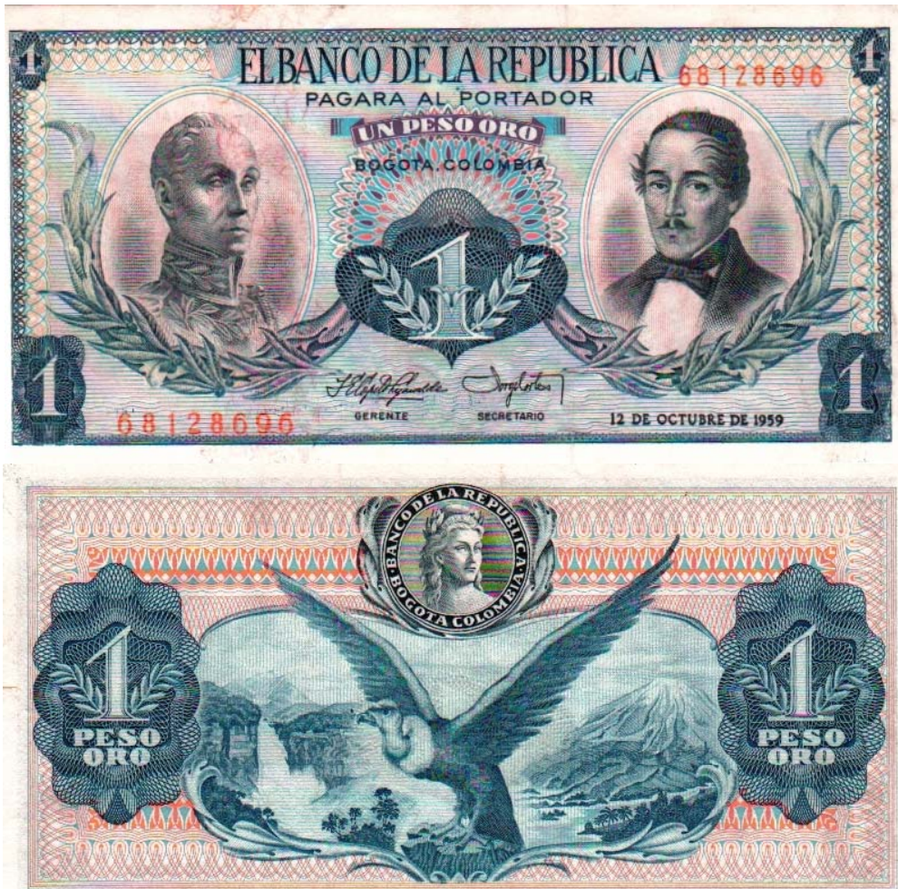
Banco de la República, un peso, 1959 (anverso y reverso)

En el reverso, está ilustrado con la imagen de un cóndor con las alas desplegadas, y al fondo, un paisaje con un salto de agua, un río y un nevado. El último año de emisión de esta pieza fue 1977.