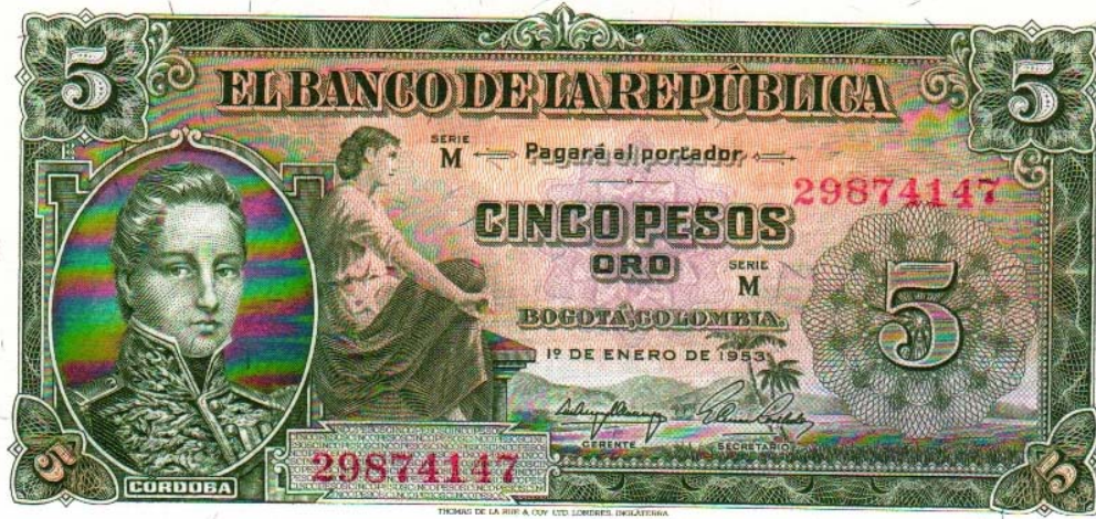
Banco de la República, cinco pesos, 1953

Pick 399 y 405. Estas piezas fueron impresas por la firma Thomas de la Rue Company.