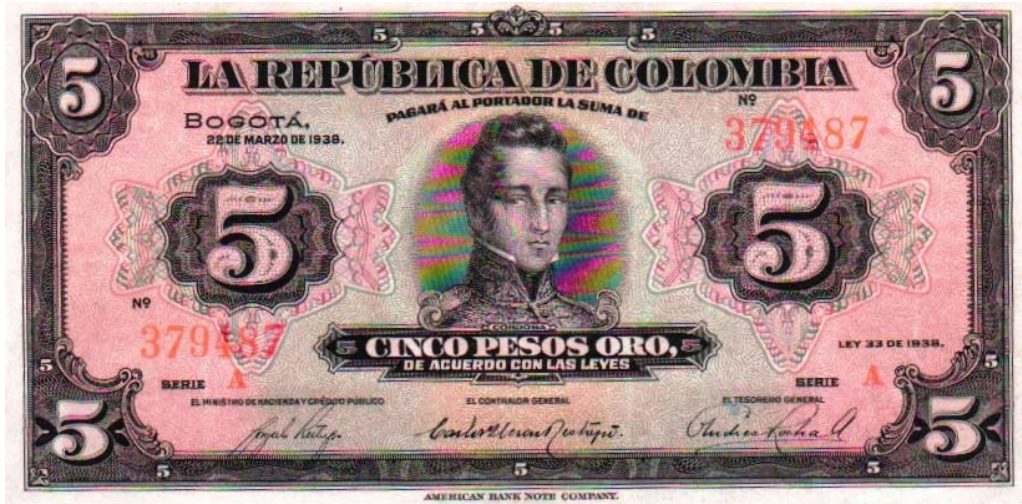
República de Colombia, cinco pesos, 1938

En el año de 1938, la República de Colombia emitió un billete por valor facial de cinco pesos, bajo la Ley 33 de 1938. En el mismo, el general Córdova ilustra la parte central. Bogotá 22 de marzo de 1938, pick 341.