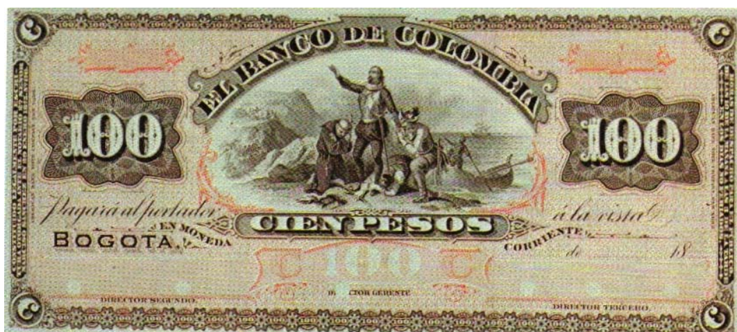
Banco de Colombia, cien pesos, 1881.