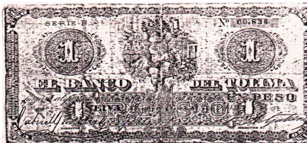
Banco del Tolima, un peso, 1882