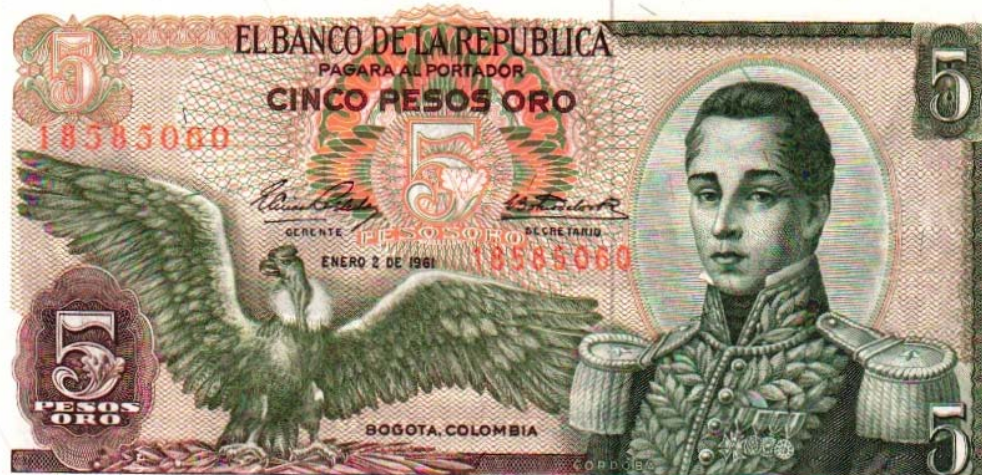
Banco de la República, cinco pesos, 1961

El último billete de cinco pesos con la imagen del general Córdoba, salió en el año de 1961, siendo impreso por la recientemente creada imprenta de billetes del Banco de la República. De esta especie hubo varias fechas, la última fue 1 de enero de 1981. Eso quiere decir, que este diseño duró veinte años en circulación, hasta que fue reemplazado por la moneda de cinco pesos. El billete tiene por el anverso al lado derecho, la imagen de Córdoba, y a la izquierda, el cóndor de los Andes con sus alas desplegadas. Cinco pesos oro, enero 2 de 1961. Pick 406.