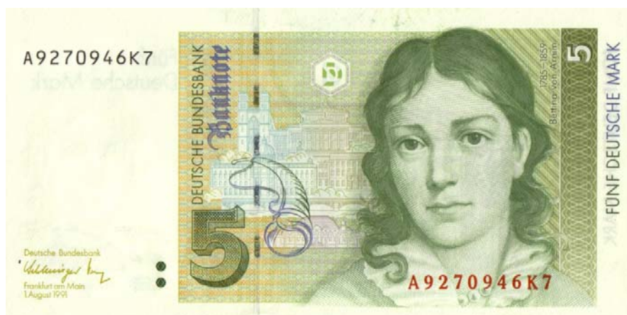
Deutsche Bundesbank, 5 marcos, 1989-2001 (Bettina von Arnim)