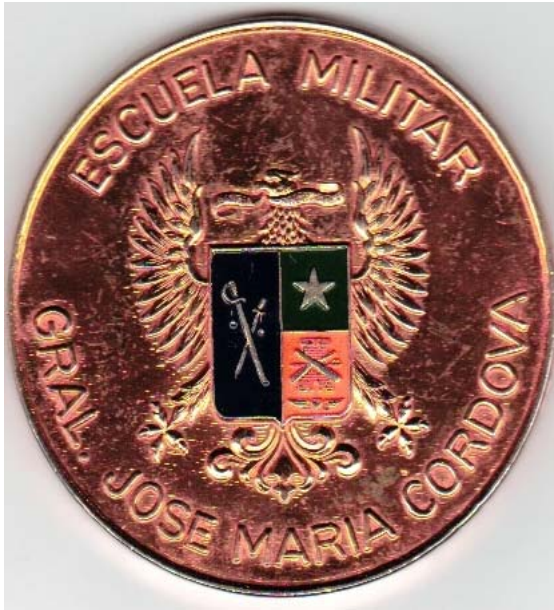
Escuela militar José M. Córdova