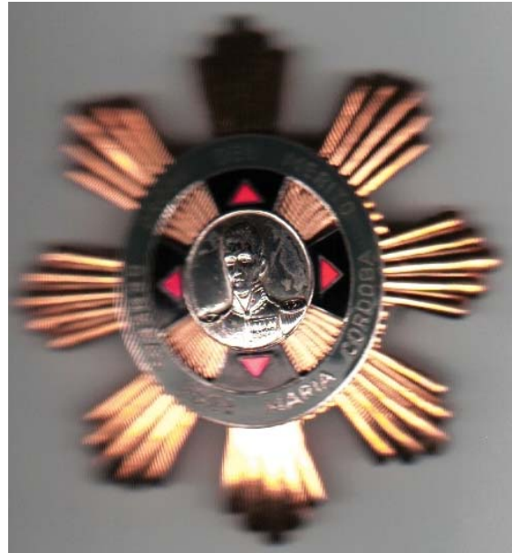
Orden del mérito General José M. Córdova