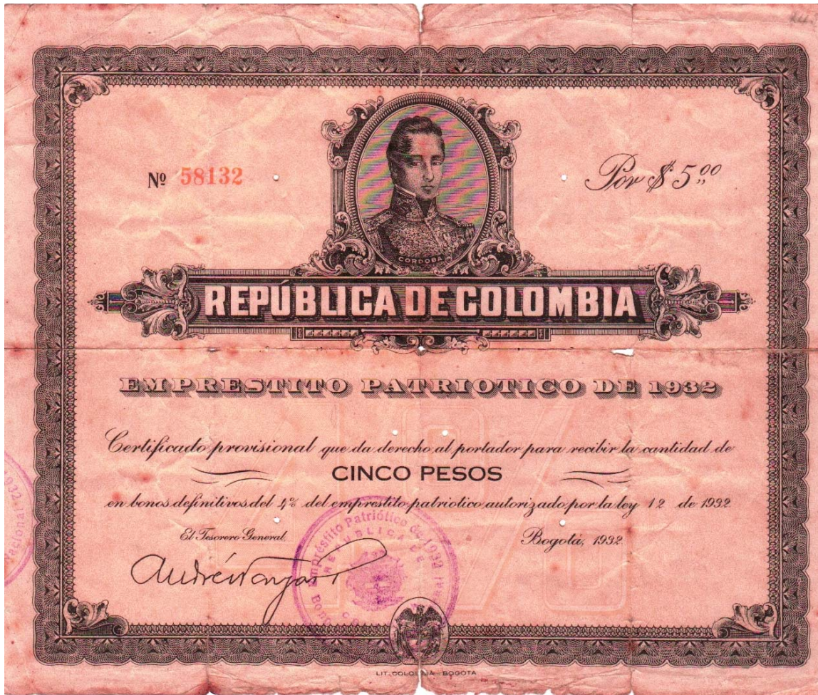
República de Colombia, cinco pesos, empréstito patriótico 1932.

1932 que se denominó "empréstito patriótico de 1932" en bonos de cinco y diez pesos, ilustrados con la imagen de José María Córdova en la parte central. Fueron impresos en la Litografía Colombia de Bogotá. Aquí les mostramos el de cinco pesos, sin serie, cinco dígitos, sello en la parte central inferior. Es unifax.