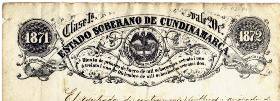
Encabezamiento de una hoja de papel sellado del Estado Soberano de Cundinamarca por el bienio de 1871-1872, clase 1ª. Valor 20 centavos. 1871 es el año de los bonos flotantes.