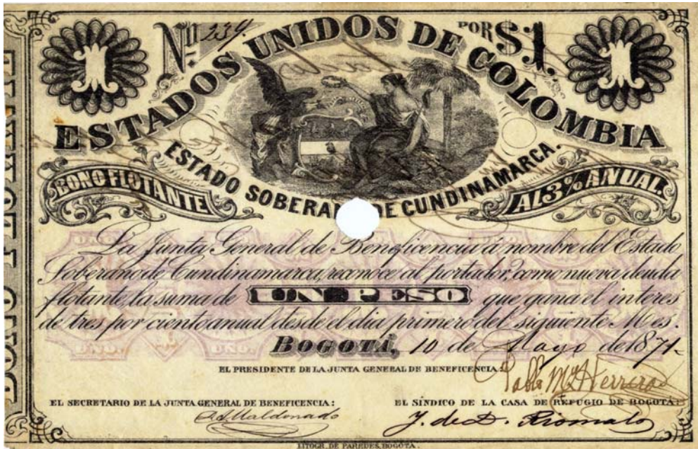
Estado Soberano de Cundinamarca, Un peso, bono flotante

Esta fue una serie muy bien lograda, en fino papel, con diseños llamativos y elegantes. Son unifax y todos aparecen con diferentes anotaciones. Son bien raros.