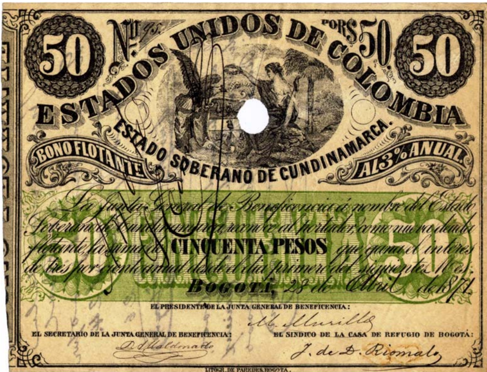
Estado Soberano de Cundinamarca, cincuenta pesos, bono flotante