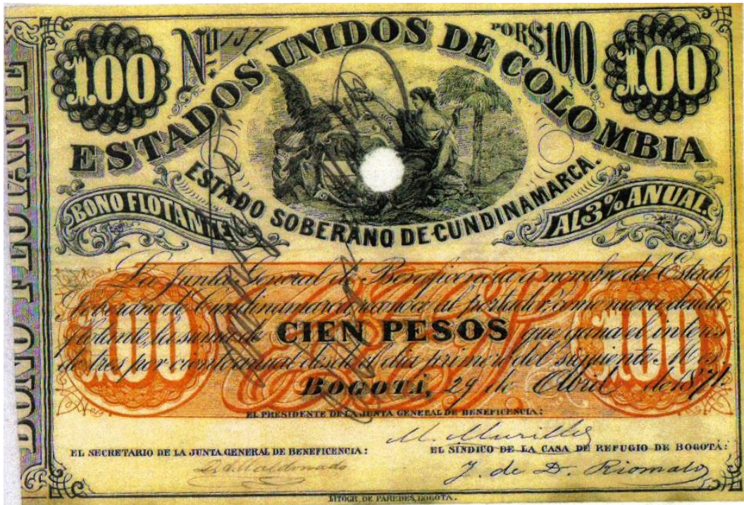
Estado Soberano de Cundinamarca, cien pesos, bono flotante