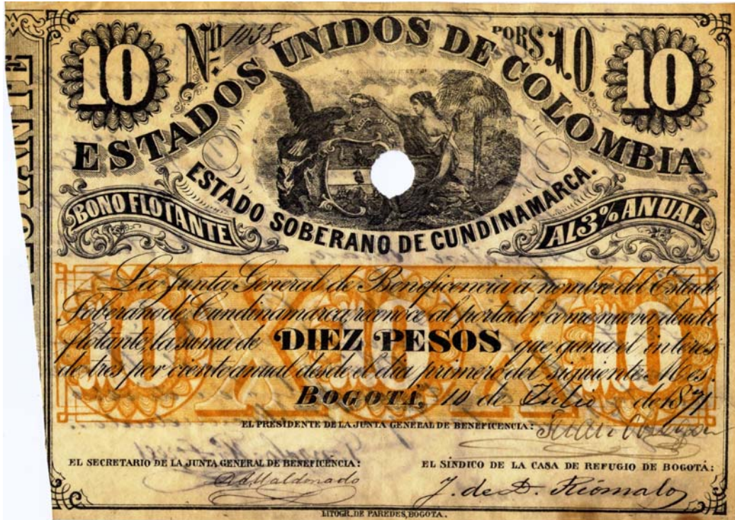
Estado Soberano de Cundinamarca, diez pesos, bono flotante