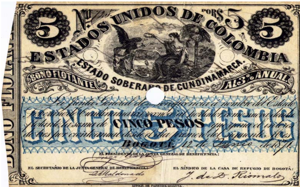
Estado Soberano de Cundinamarca, cinco pesos, bono flotante